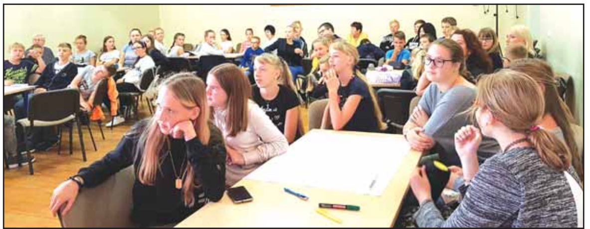
Į(si)traukimo į mokymą(si) savaitė, vedama kiekvieno rugsėjo pirmąją savaitę.