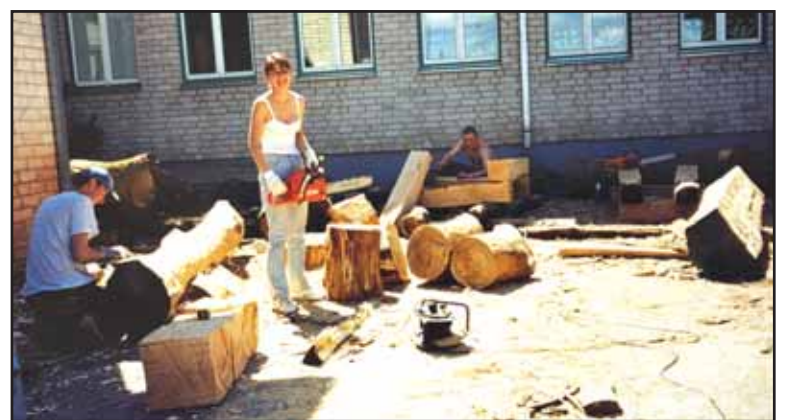
„Skulptūrų simpoziumas“ – 2004 m. birželis.

Išlaužo mokyklos 100-mečio paminėjimo darbo grupė