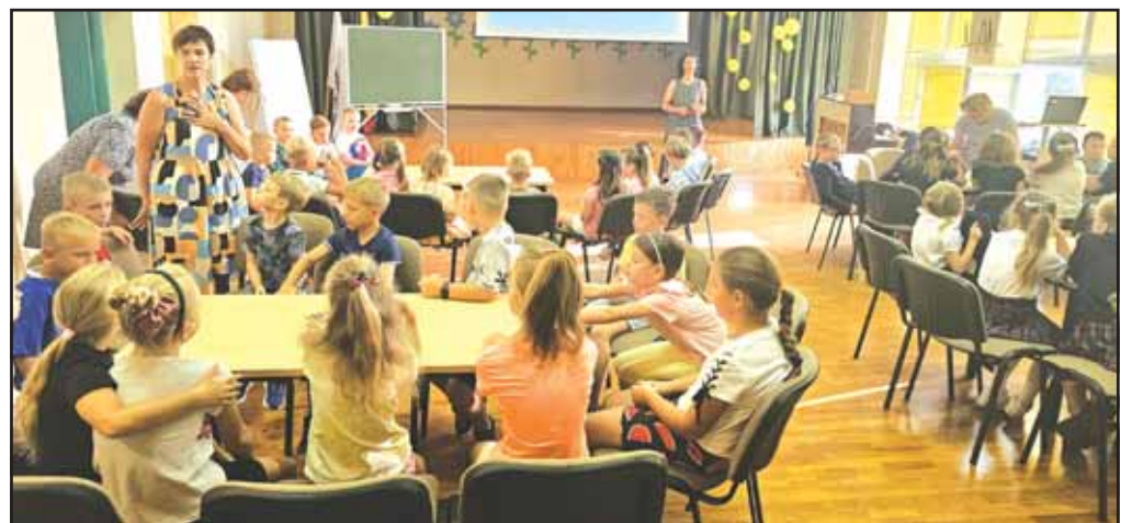
„Aktyvusis susirinkimas“, 2024 m.