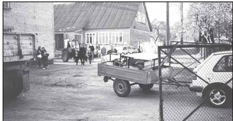
„Kraustymasis“, 2000 m. spalio.

atmintis. Tuomet sau sakau – „suvirė smegenys“.