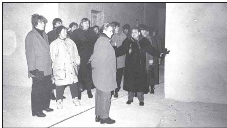
2000 m. pavasaris, „žvalgoms“.

Statybos atnaujintos 1998 m., o 2000 m. Prienų r. vadovų ir mo-