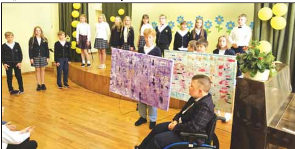
Tradicinė mokslo metų užbaigimo šventė „Pasidžiaukime“, 2024 m.