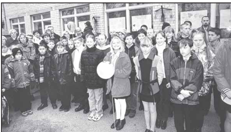
Jau pasiruošę visiškai iškelti, 2000-10-20.