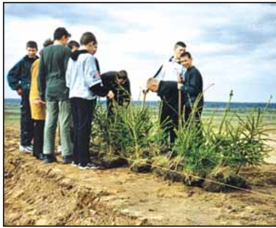
2004 m. mokyklos aplinkos tvarkymas.

Visada mums buvo svarbus mokinio įsitraukimas į jo paties mokymosi įsivertinimą bei planavimą. Kai 2006 m. direktorė, grįžusi iš švietimiečių kelionės po Škotijos mokyklas, pasidalino išpūdžiais, kaip tos šalies mokiniai stebi ir planuoja savo mokymąsi, to ėmėmės ir mes. 2007–2008 mokslo metais direktorė, dalyvaujant pavaduotojai ir klasių vadovui, pakalbino visus 5–10 klasių mokinius jų paprašydama pasidalinti sėkmėmis ir nesėkmėmis, įvardinti, kokios pagalbos jie norėtų (sunkiausia mokiniams buvo įsivardyti tos pagalbos poreikį). Tam tikslui susikūrėme asmeninės pažangos fiksavimo dokumentą, kurį kiekvienas 5–10 klasių mokinys pildo iki šiol ir aptarinėja savo pasiektą pažangą ne tik su klasės vadovu/vadovu, bet ir su jį mokiniais mokytojais pasibaigus trimetrams/mokslo metams tvarka-