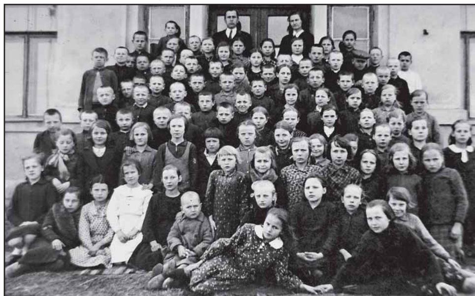
Mokiniai su mokytojais prie Išlaužo mokyklos pastato Žvejų gatvėje. 1937 m.