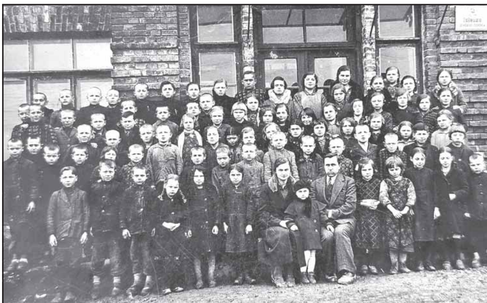
Išlaužo pradžios mokykla. 1932 m.