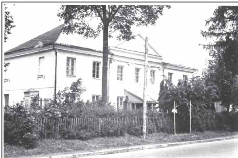
Veiverių mokytojų seminarija 1936 m.