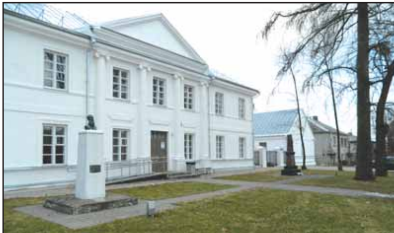
Pastatas, kuriame veikė Veiverių mokytojų seminarija, dabar jame įsikūrusi Antano Kučingio meno mokykla.