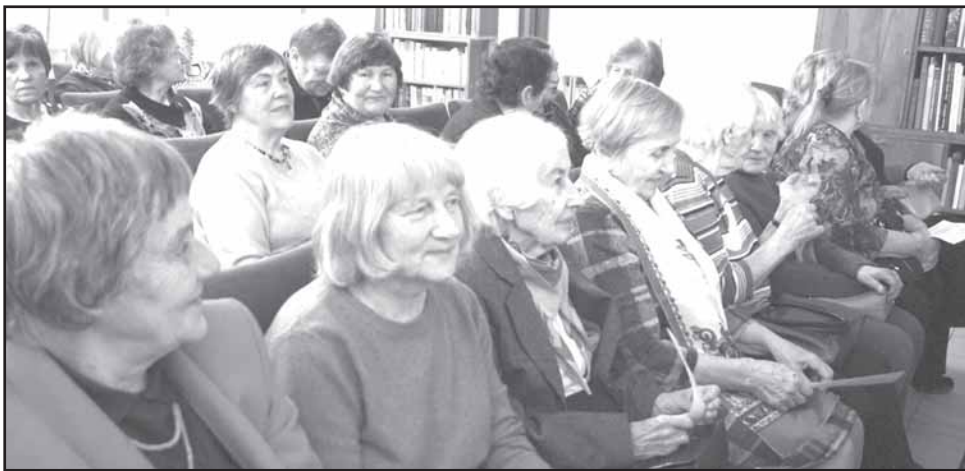
Pilietinės-kultūrinės akcijos „Skaitome Justiną Marcinkevičių“ akimirkos.