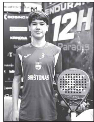
Jonathan dar daugiau pergalių ateityje!

Birštono sporto centras didžiuojasi šiais pasiekimais ir linki