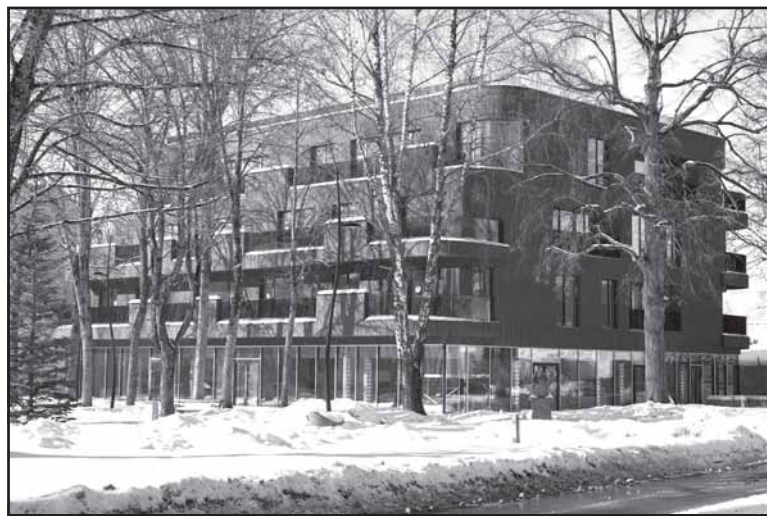
Daugiabučių apartamentai – Birštone.

„Prienų langai“ – tai 26 metų langų bei durų gamybos ir pardavimų srityje Prienuose veikianti įmonė. Jos istorijoje jau 22 metai yra ženklūs aktyvia gamybos patirtimi. Per šį laiką įgyvendinta daugybė projektų ir atliekant privačių klientų užsakymus, ir bendraujant su verslu bei daugiabučių namų statybos vystytojais. Pasak įmonės vadovų, jeigu klientams svarbus kokybiškas, profesionalus ir savalaikis darbų atlikimas, „Prienų langų“ komanda visada pasirengusi padėti – nuo pirminės konsultacijos iki galutinio sprendimo įgyvendinimo.