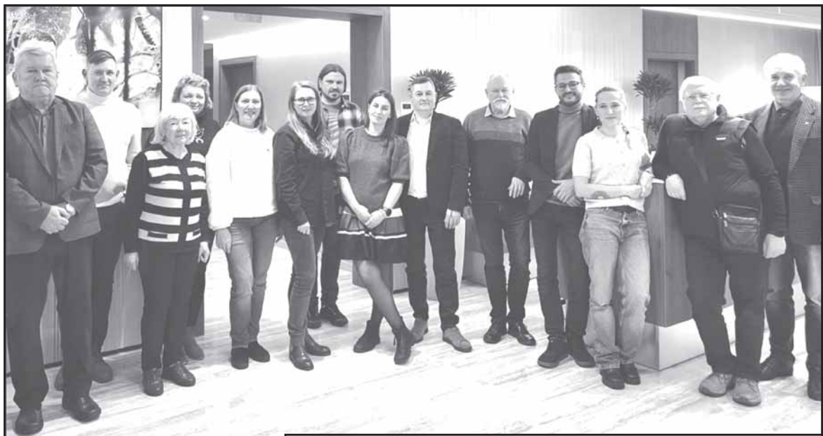
Grupė Prienų atstovybės narių po susitikimo „Vermės“ sanatorijoje.