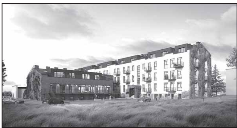
Molėtuose įgyvendinamas gyvenamųjų apartamentų ir butų projektas.