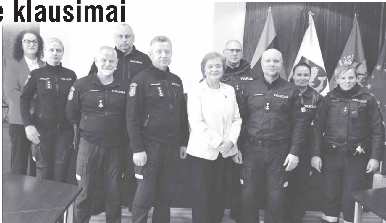
Birštono PK pareigūnai su Birštono savivaldybės, Alytaus AVPK bei prokuratūros atstovais.

Praėjusiais metais Birštono PK pareigūnai kartu su partneriais vykdė nemažai netradicinių prevencijos priemonių. Organizavo konkursą „Saugūs kelyje“ 1-4 klasių mokiniams bei 112 tarnybų profesijų populiarinimo renginį gimnazijoje. Bendradarbiaujant su Meno mokykla išleista piešinių knygelė apie Lietuvos policiją, kartu su Birštono sporto centru organizuotas žygis „Judu dviračiu“. Prisidedant Birštono savival-