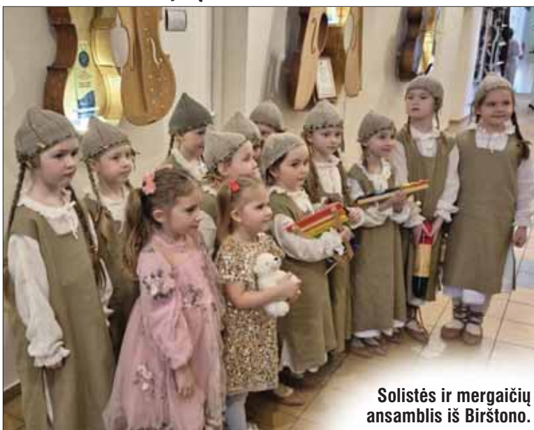
Solistės ir mergaičių ansamblis iš Birštono.

Sausio 28 dieną Marijampolės meno mokykloje vyko Lietuvos vaikų ir moksleivių televizijos konkurso „Dainų dainelė“ antrasis regioninis turas, kuriame pasirodė talentingi dainininkai iš viso regiono, tarp jų – ir pirmojo turo koncertuose atrinkti atlikėjai iš Prienų rajono bei Birštono savivaldybių.