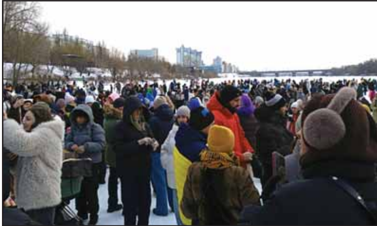
Flash mob'as įjungta Kyjivas Rusanovka, remianti Achilo karinę brigadą.

Gyvenimas Kyjive apledėjusiuose daugiabučiuose tapo išlikimo klausimu. Rusijos raketos apgadino Kyjivo šiluminės elektrinės ir praktiškai kiekvieną ypatingos svarbos infrastruktūros objektą. Nors visos pastangos ir buvo sutelktos į griuvėsių valymą ir šiluminių elektrinių atstatymą, bet keli tūkstančiai pastatų patyrė vandens nuotėkius, todėl butai tapo netinkami gyventi.