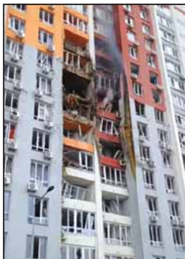
Savižudžio sprogdintojo atvykimas į namą Kachovskajos gatvėje, akivaizdu, kad apgadinti 8 butai.

Žiemos naktį Maskvos Obolono rajone visiškoje tamsoje įvyko