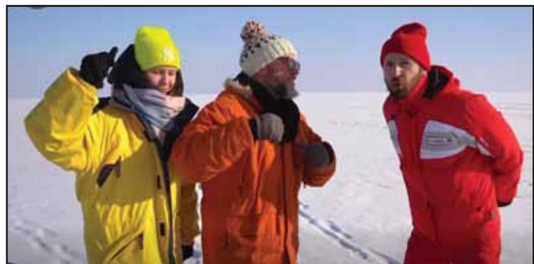
Kyjivo „festivalio“ prie Kyjivo jūros šeiminkai.