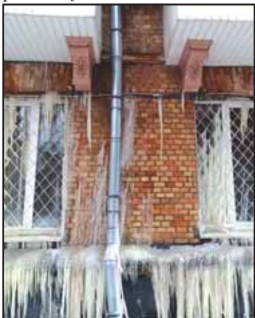
Pečerskas, Citadelnaja gatvė. Vanduo iš vamzdžio per visus plyšius tekėjo į gatvę.

Dabar, siaučiant žvabiam šalčiui, panašiam kaip ir Lietuvoje, Kyjivo gyventojų butuose temperatūra siekia 11–13 °C, o kai kuriuose – arti nulio, nes šimtai pastatų lieka be šildymo. Tikslų tokių pastatų skaičių Kyjive nustatyti sunku. Padėtis keičiasi kasdien, o per dieną – net kelis kartus.