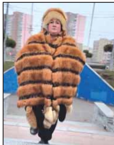
Keistuolių šou Troješčinos rajone, išgyvenančiame tikrą bendruomenės katastrofą.