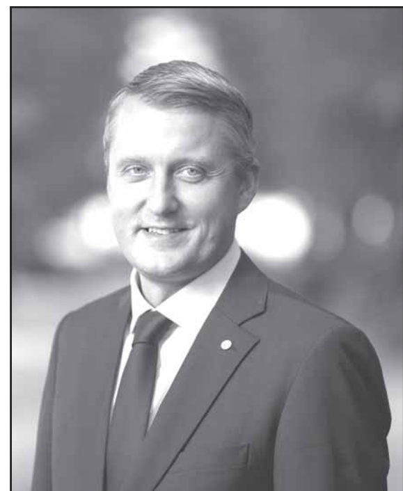
Energetikos ministras Žygimantas Vaičiūnas.

2. Įsitikinus, kad visuomeninis tiekimas gy-