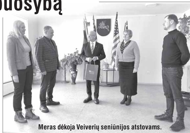
Meras dėkoja Veiverių seniūnijos atstovams.

Tikimės, kad kitais metais prie šios iniciatyvos prisijungs dar daugiau