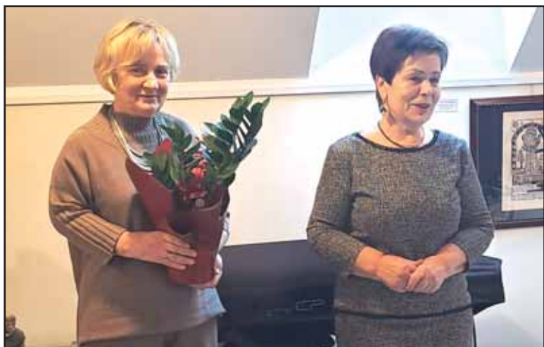
Muziejaus sukakties proga sveikina Birštono karitietės.