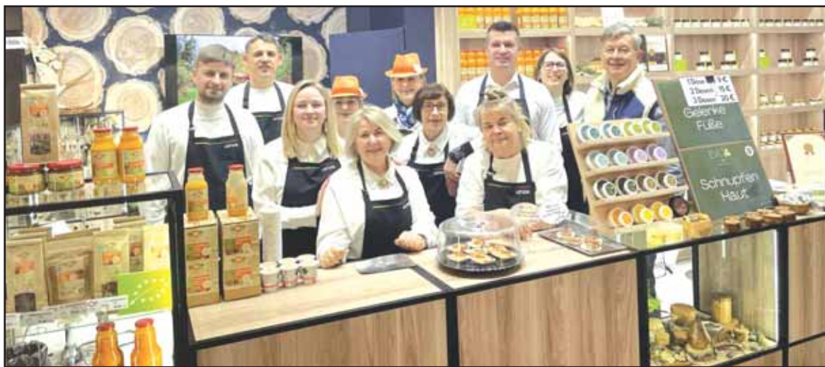
UAB „Evija & Partner“ komanda savo produktus reklamuoja pasaulinėje parodoje „Žalioji savaitė“ Berlyne.