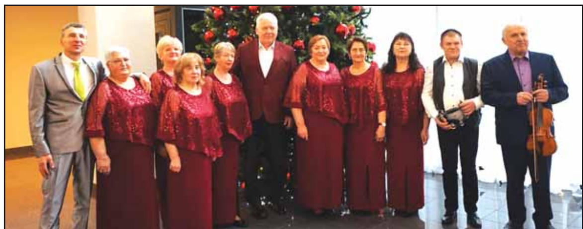
„Vilties paukštės“ finaliniame konkurse pasirodė ir prieniškių ansamblis „Nemunaičiai“.