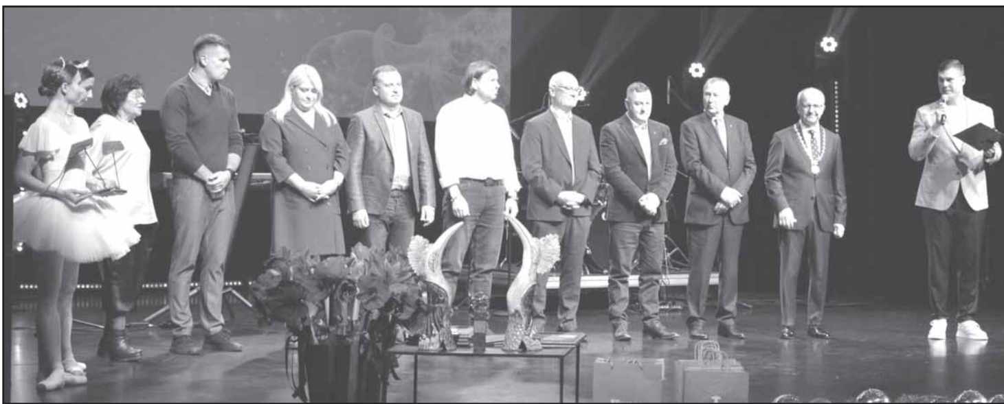
Pagerbti konkurse „Sukurta Prienų krašte“ dalyvavusių šešių Prienų rajone veikiančių verslo įmonių vadovai.