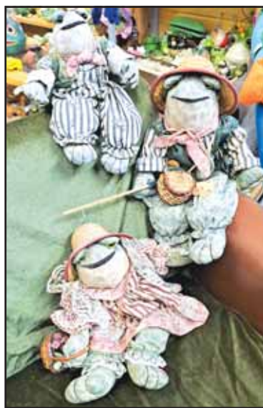
Kolekcinė varlių šeimynėlė.