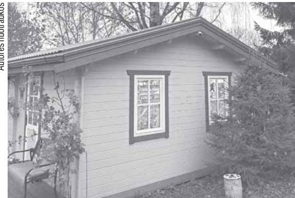
Varlių kolekcijai pastatytas žalias namelis.