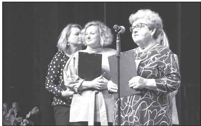
Vertinimo komisijos narės skelbia rezultatus.