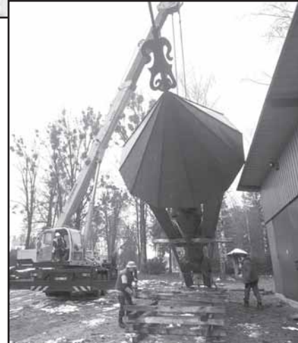
Stogastulpiams iškrauti prireikė kranų.