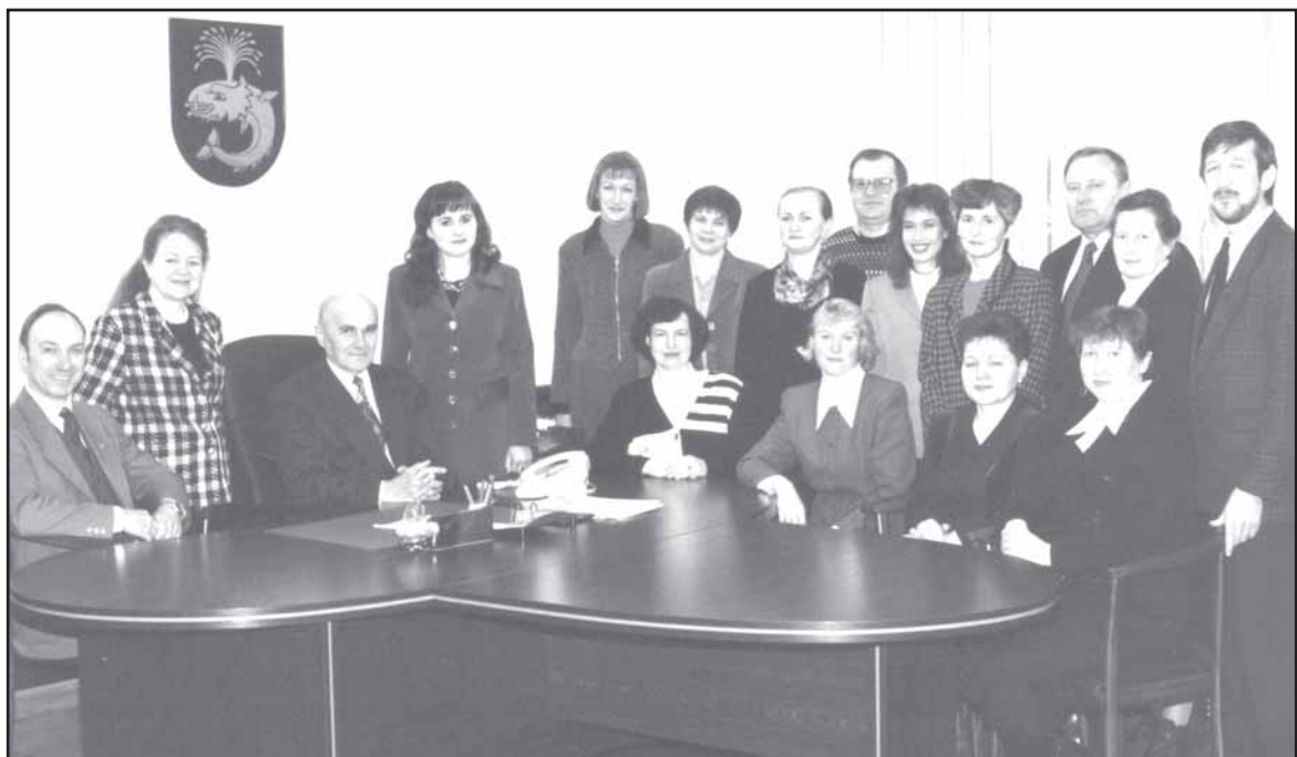
Birštono savivaldybėje su kolektyvu.