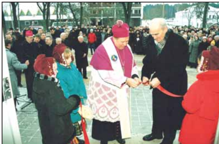
Prieš 25-erius metus. Birštono sakralinio muziejaus atidarymo iškilmėse.