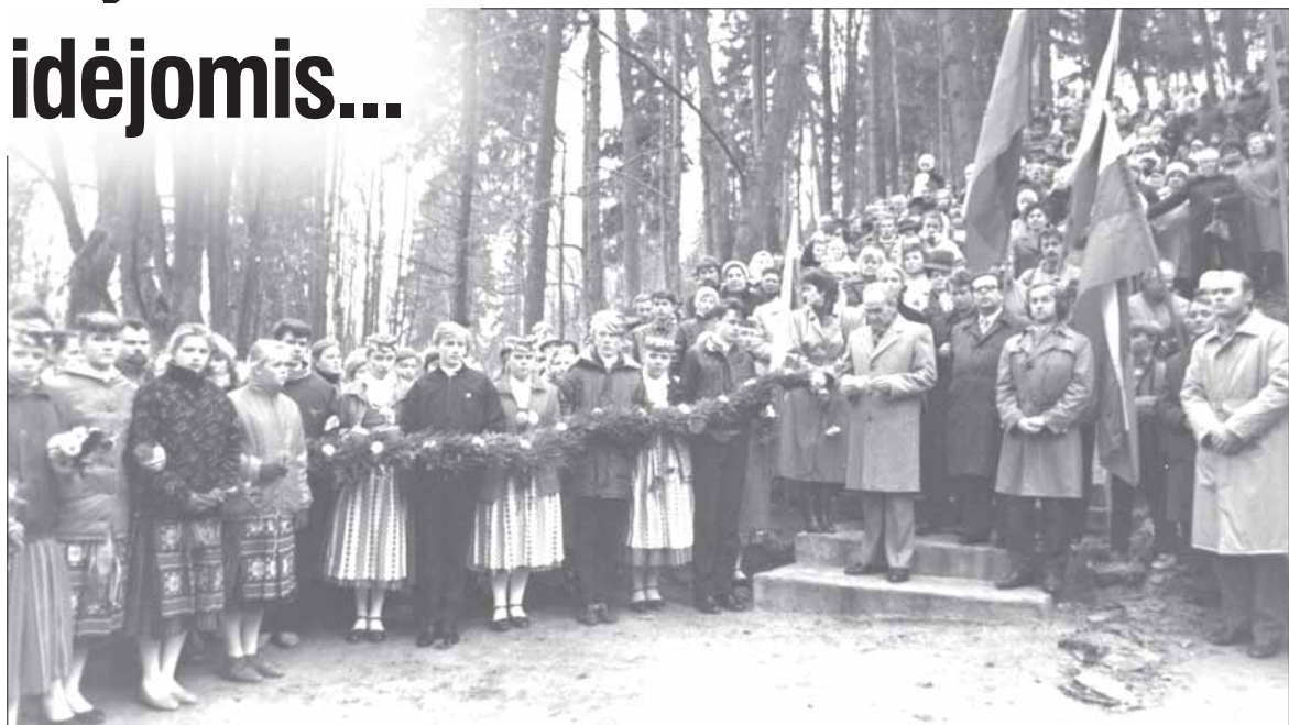
Sąjūdžio mitingė Birštone.