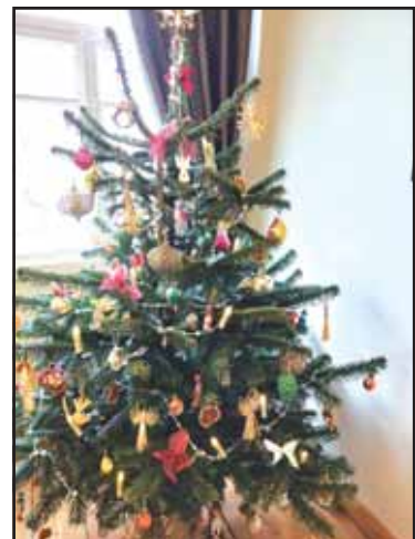
Tarpukario stiliaus eglutė.