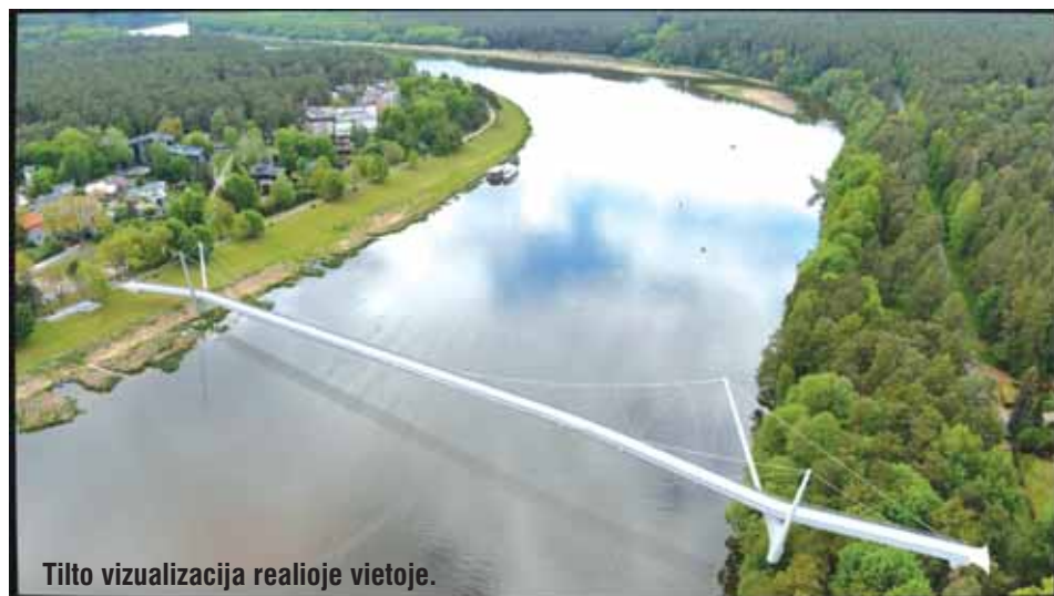
Tilto vizualizacija realioje vietoje.

Dešiniajame Nemuno krante pradėta įrengti moderni įlaida vandens transportui, o prie apžvalgos bokšto jau sutvarkytas privažiavimas, įrengtas apšvietimas ir 40 vietų automobilių aikštelė. Artimiausiu metu pla-