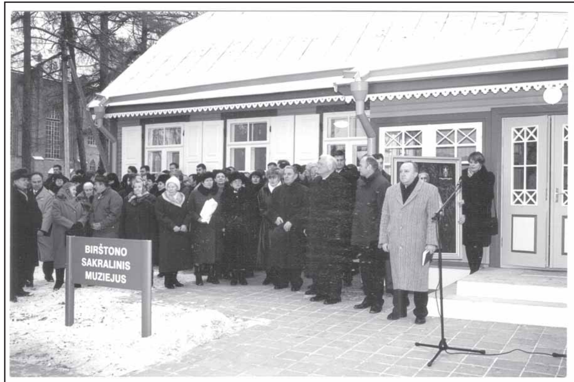
Garbingi svečiai, gyventojai – Sakralinio muziejaus įkurtuvėse. 2000 m.