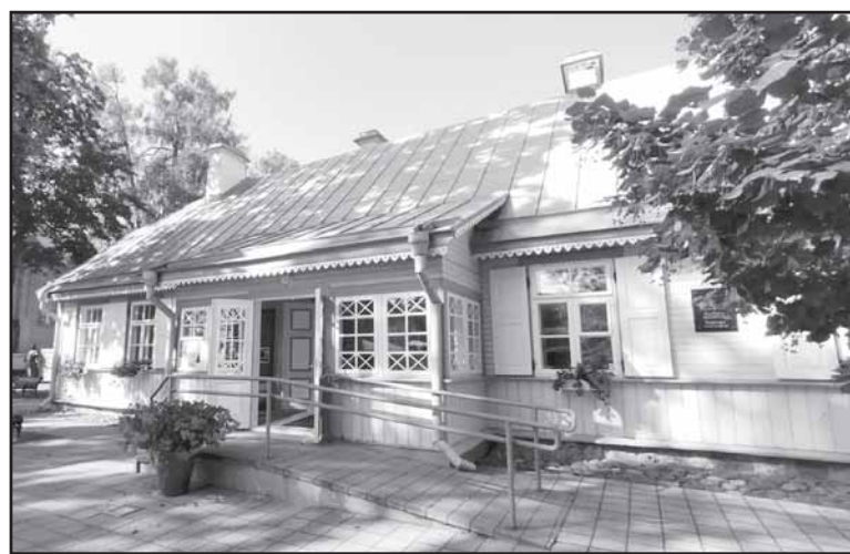
Birštono sakralinis muziejus – šiandien.