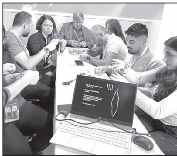
Muziejuje veikia nuolatinės ekspozicijos, rengiamos parodos, susitikimai, edukacijos.