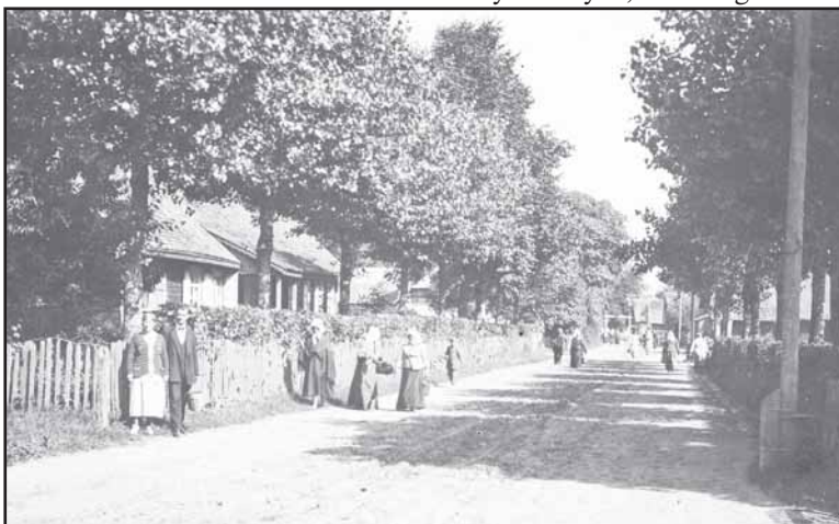
Birutės gatvė, Birštonas. XX a. pr. Birštono muziejaus rinkiniai.