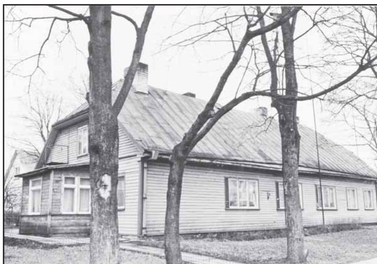
Klebonijoje įrengti komunaliniai butai 1975. BM IV-296.