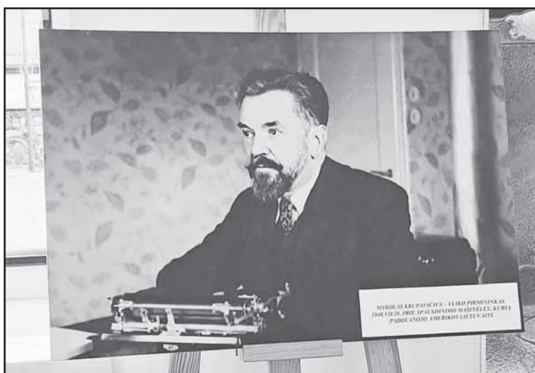
Balbieriškio bibliotekos archyve saugoma M. Krupavičiaus fotografijos kopija.