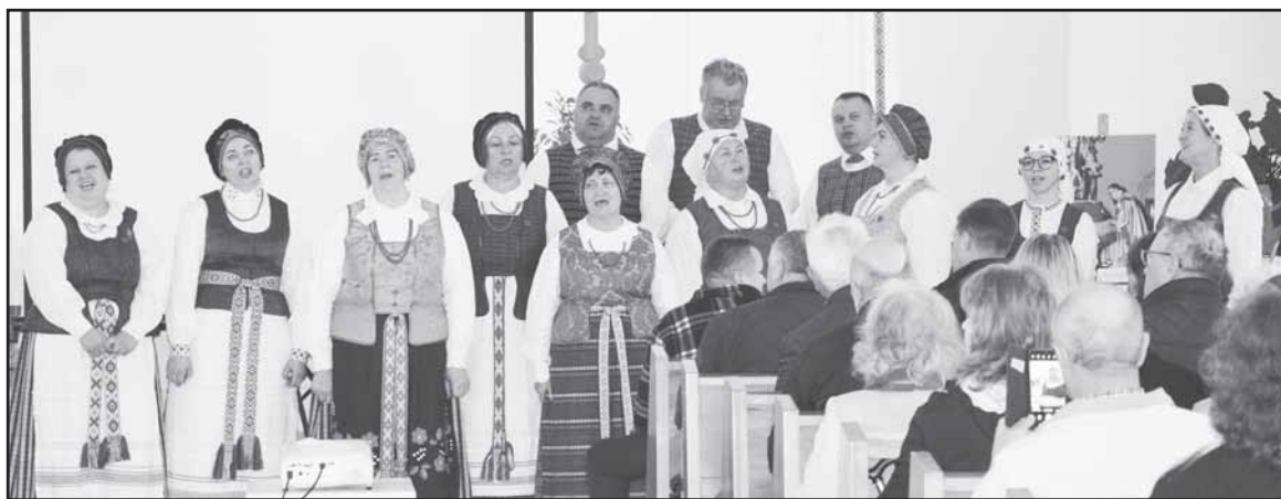
Balbieriškio KLC folkloro ansamblio „Dūmė“ atliko liaudies dainų.

nusiteikę priešikais. Tiesus, drąsus, tvirtos krikščioniškos pasaulėžiūros, gerai apsiskaitęs, filosofiskai pasirengęs, turėjęs oratorinių gebėjimų Mykolas Krupavičius aktyviausiai savo veiklos dešimtmečiais buvo neparankus nė vienai valdžiai.