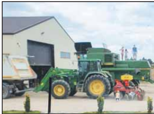
Prieš javapjūtę technika išvarymas iš garų į laukus. Vaikams tai – įdomus reiškinys.