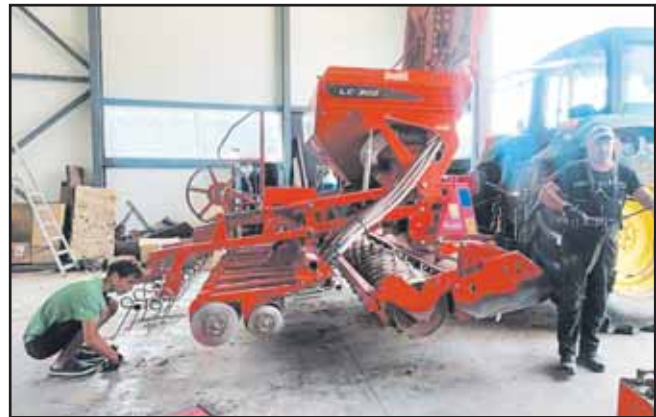
Sėjamosios paruošimas prieš rapsų sėjimą. Sūnus jau realus talkininkas, ir tai labai džiugina tėvus.