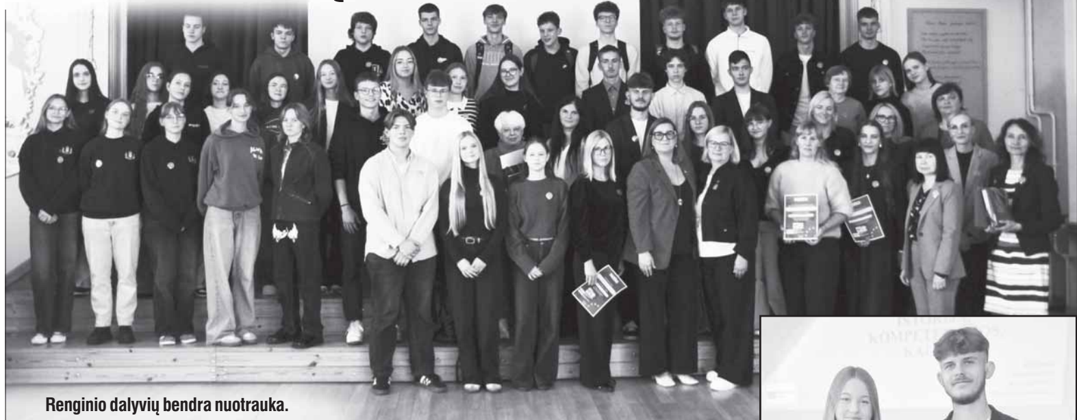
Renginio dalyvių bendra nuotrauka.

Šios pilietiško pamokos skatina moksleivius domėtis bei mokytis užsienio kalbų, padeda geriau pažinti Europos kultūras. Pagrindinis siekis – sudominti moksleivius, kad jie mokytųsi ne vieną, o daugiau užsienio kalbų. Juk kalbų mokėjimas – tai