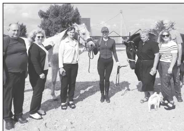
Žirgai mielai pozavo ir su apžiūros komisijos nariais.

Reikės: 800 g miltingų bulvių, 150 g virtos dešros, 2 česnako skiltelių, 1 šaukšto saulėgrąžų aliejaus, 2 šaukštų kapotų petražolių, 4 žalių ar raudonų saldžiųjų paprikų (800