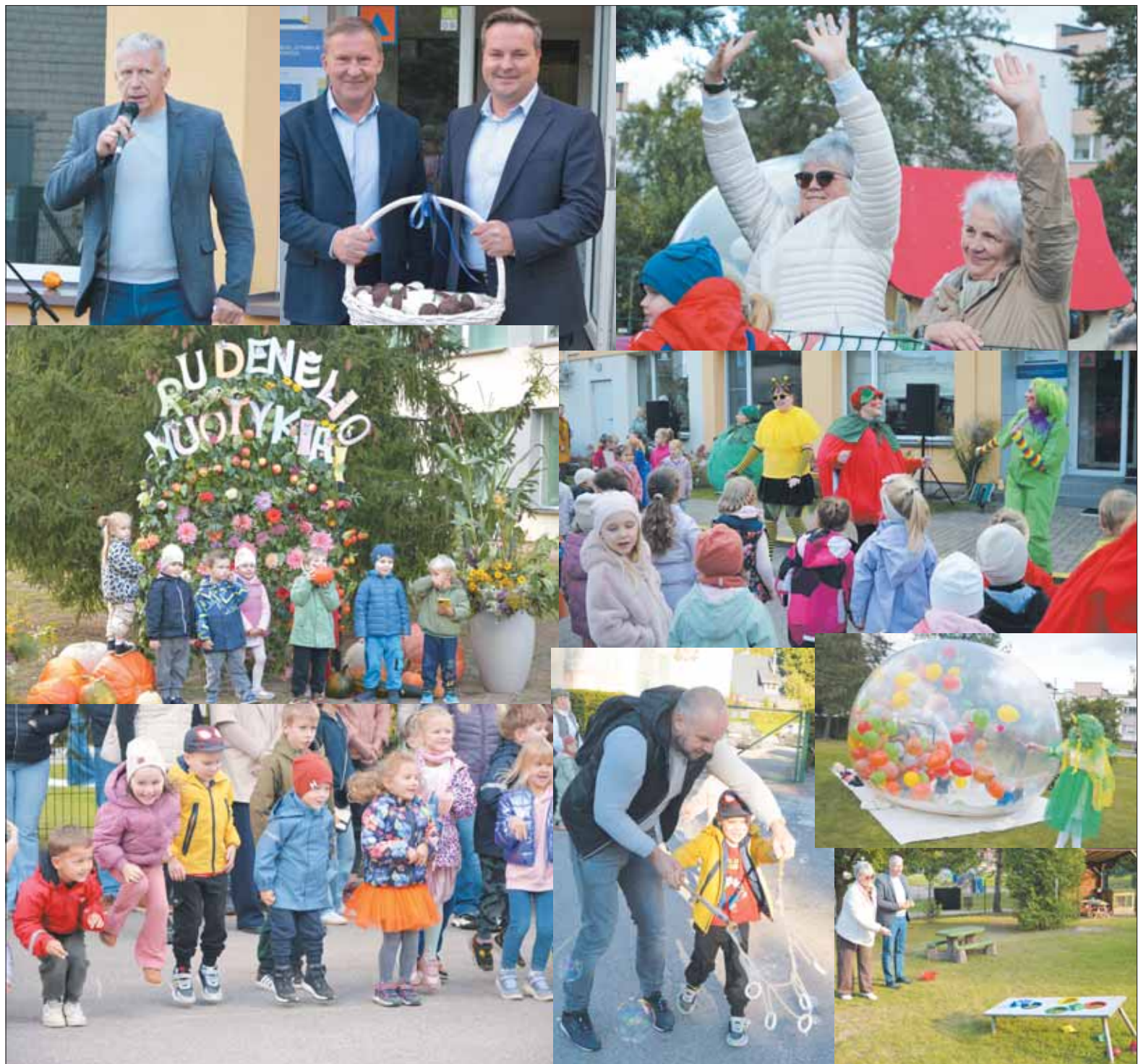
Rudenėlio šventė dovanojo daug džiaugsmo ne tik vaikučiams, įvairios kūrybinės ir sportinės veiklos subūrė visą darželio bendruomenę.

„Gyvenimas“ – tiltas tarp žmonių, įvykių ir idėjų.