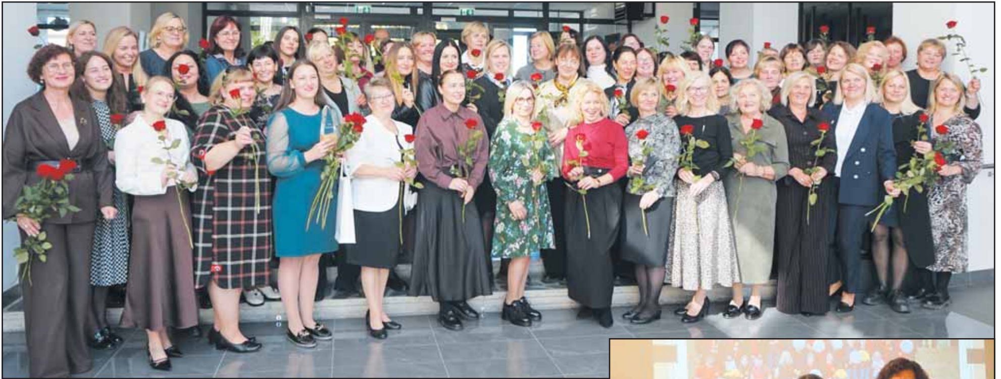
Socialinių darbuotojų šventės dalyviai.