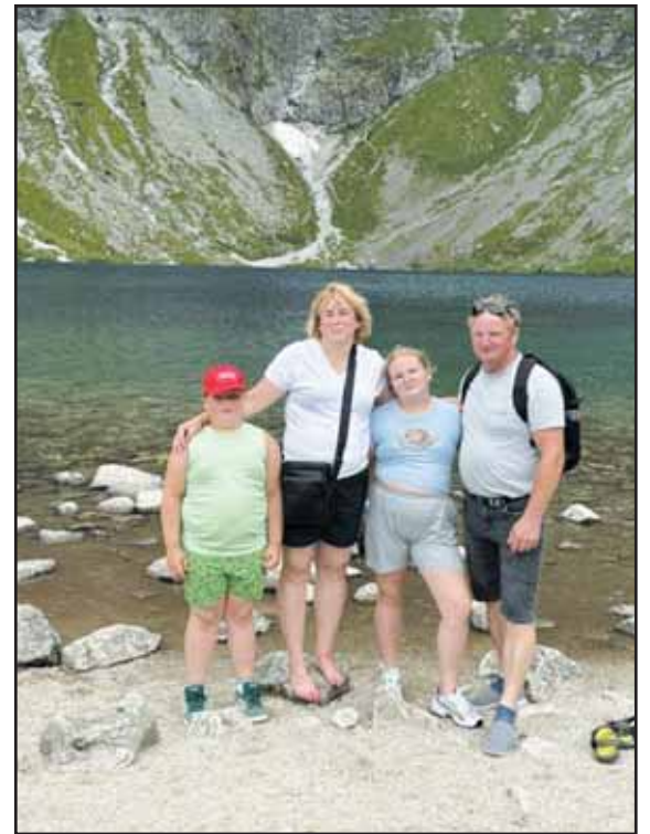
Atostogų maršrutai Balsevičius nuveda ir į svečias šalis.