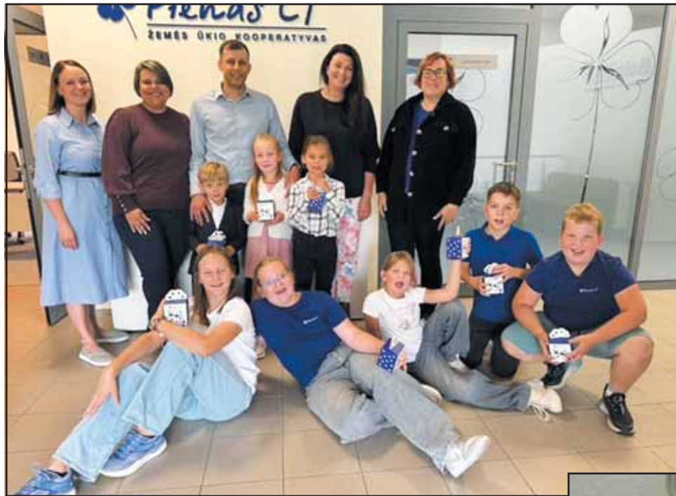
„Pienas LT“ jaunųjų ūkininkų akademijos užsiėmime.