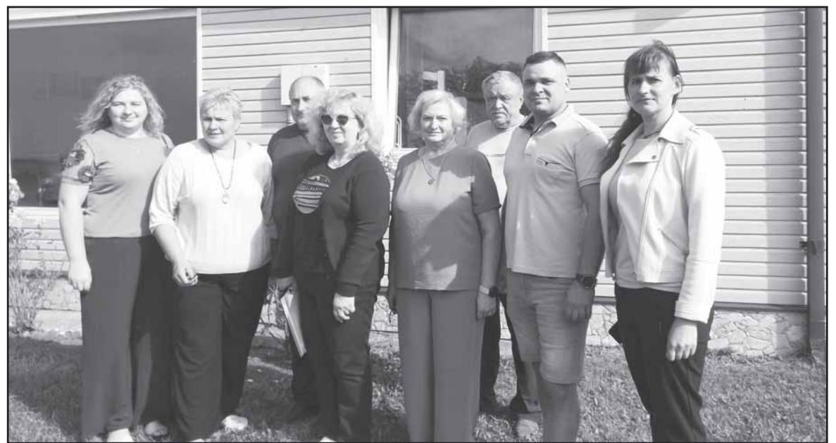
Ūkininkai Raiziai – su „Metų ūkio“ konkurso apžiūros komisijos nariais.