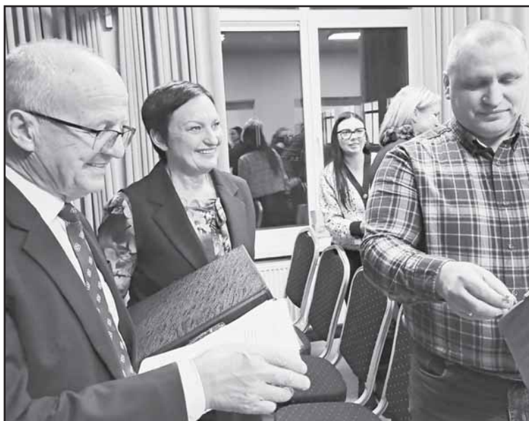
Aktyvūs Stakliškių gimnazijos ir seniūnijos bendruomenių atstovai ir žodžiu, ir raštu reikė susirūpinimą dėl vykdomos švietimo politikos, kuri, pasak jų, nėra palanki kaimiškoms mokykloms.