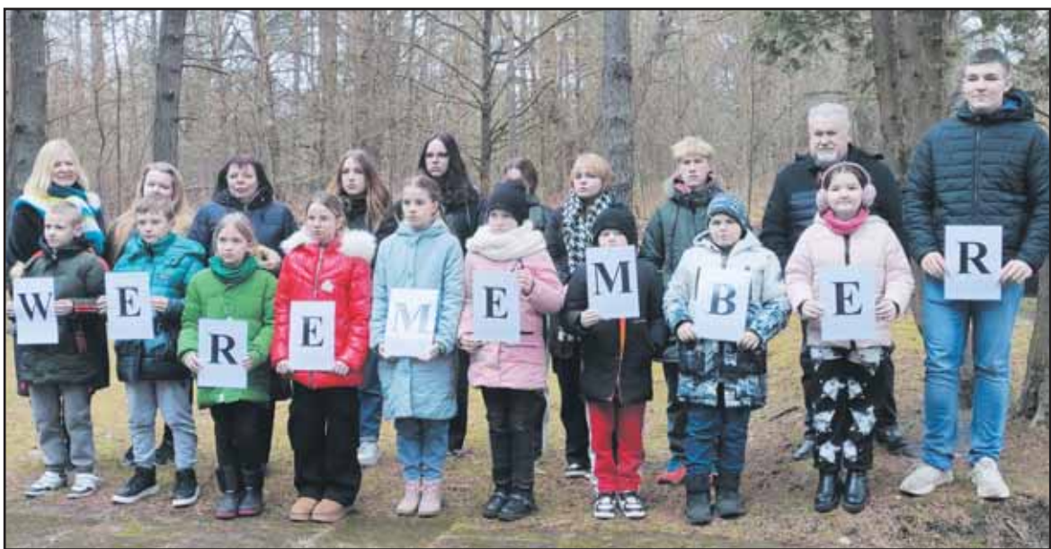
Balbieriškio pagrindinės mokyklos bendruomenė didelį dėmesį skiria žydų tautos tragedijos atminimui.