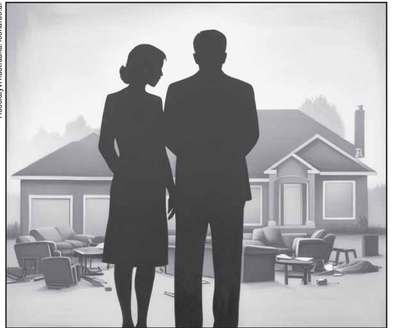
Asociatyvi nuotrauka.