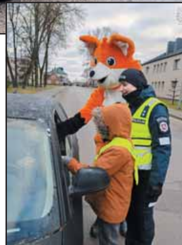
Visą gruodį rajono keliuose policija vykdė reidus, taikė prevencines priemones.

sulaikyti vairuotojai „įpūtė“ 1,51 ir daugiau promilių, todėl jiems pradėti ikiteisminiai tyrimai pagal Baudžiamojo kodekso 281(1) straipsnį „Transporto priemonių vairavimas, kai vairuoja neblaivus asmuo“ per praėjusių metų vienuoliką mėnesių buvo pradėti 46 ikiteisminiai tyrimai, du – nutraukti nenustačius nusikaltimo sudėties. Vairuotojams dažniausiai nustatytas 2 promilių ir daugiau girtumas. Iš baudžiamojo poveikio priemonių pažeidėjams taikytas ir transporto priemonių konfiskavimas: pernai paimti 26 automobiliai (2023 m. – 32).