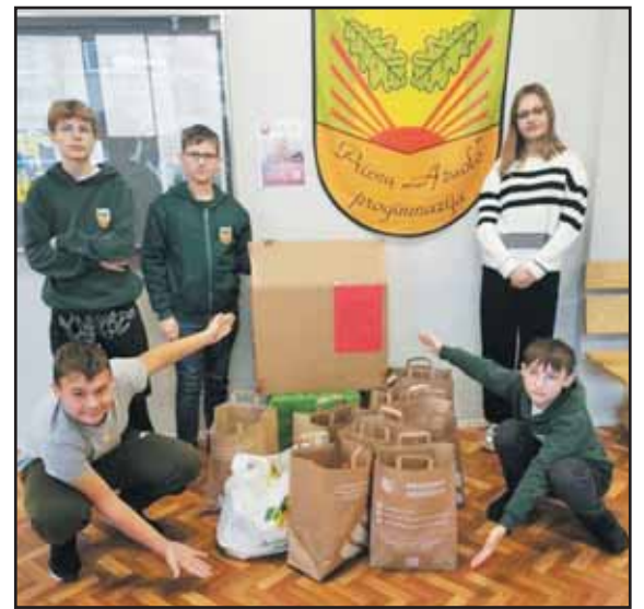
Prie gerumo akcijos prisidėjo ir „Ažuolo“ progimnazijos mokiniai.