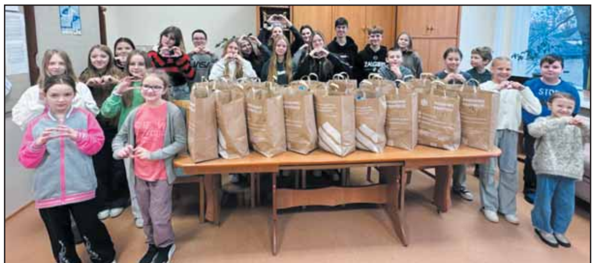
„Revuonos“ pagrindinės mokyklos mokiniai su užpildytais „Dosnumo krepšeliais“.