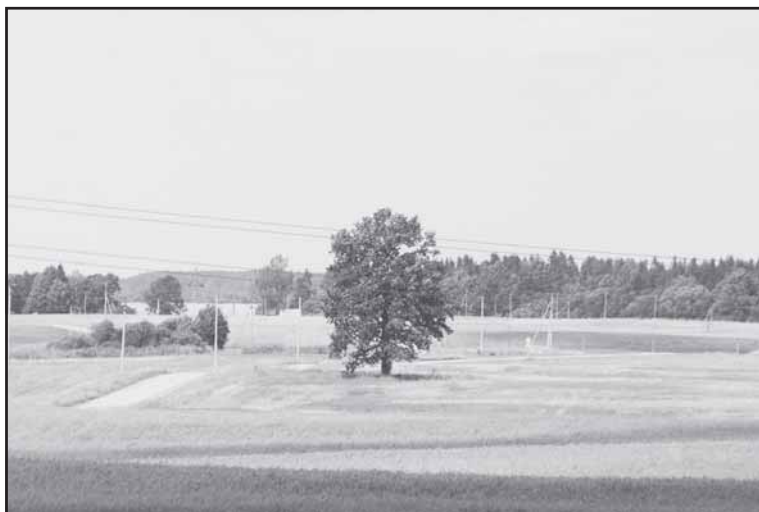
Planą konkrečiam laukui tręšti reikės sudaryti vadovaujantis Tręšiamųjų produktų aprašo nuostatomis.

Kitas šios sistemos privalumas – sistema turi sąsajas su dirvožemio monitoringo duomenimis (jei tokie yra), todėl tręšiant mėš-