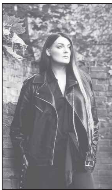
šinį kūrė „Sunny Raw Magnum“. Leidybą finansavo bei inicijavo pati autorė.

Naujausią mini albumą „Spalvos“ galima atrasti populiariose skaitmeninėse muzikos pasiklausymo platformose. Viršelio pie-