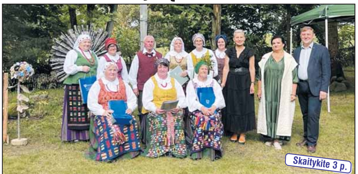
Šilavoto folkloro grupė „Akacija“ švenčia 30 metų kūrybinės veiklos sukaktį.