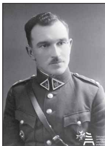
Brigados generolas K. Skučas.

Imta kaltinti Lietuvą antisovietine politika, ieškoti priekabių, siųsti į šalį karinės žvalgybos gruputes. Nariai SSRS pasiuntinybėje Kaune persirengdavo vietinių žmonių drabužiais ir, pasidalinę mažomis grupelėmis, siekė užimti apskričių policijos nuovadas. 1940 m. gegužę SSRS apkaltino Lietuvą, kad jos saugumo organai pagrobė kelis sovietų įgulų karius, o vieną, siekiant išgauti karines paslaptis, net nužudė. Lietuva teisiškai įrodė, kad tai melas, tačiau Maskva to nepaisė – apkaltino