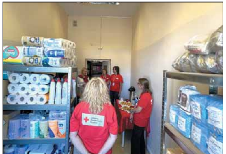
Lietuvos Raudonojo Kryžiaus Organizacijos Prienų humanitarinis punktas.

Lietuvos Raudonasis Kryžius teikia pagalbą žmonėms, atsidūrusiems krizinėse situacijose, kai dėl gaisro, stichinės ar asmeninės nelaimės, ligos, negalios gyventojai patys nebegali patenkinti savo arba šeimos narių būtinųjų poreikių.