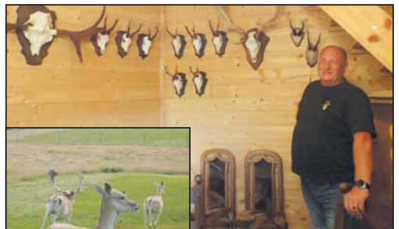
Antano Pažėros medžioklės muziejus gausus trofėjų.

keliavo net ir senus statinius laike akmenys. Įvairiai sukomponuoti jie tapo vienu iš sodybos akcentų. Kaip ir kai kurie kiti iš praeities likę relikvai.