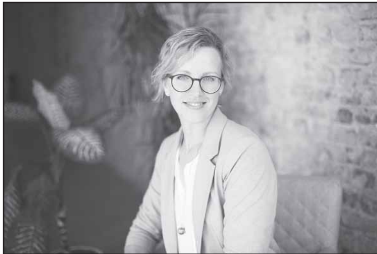
R. Mickevičienės teigimu, pogimdyminė depresija serga apie 19 proc. moterų ir 4-7 proc. vyrų.

Pastebima, kad depresinio sutrikimo epizodas gali prasidėti