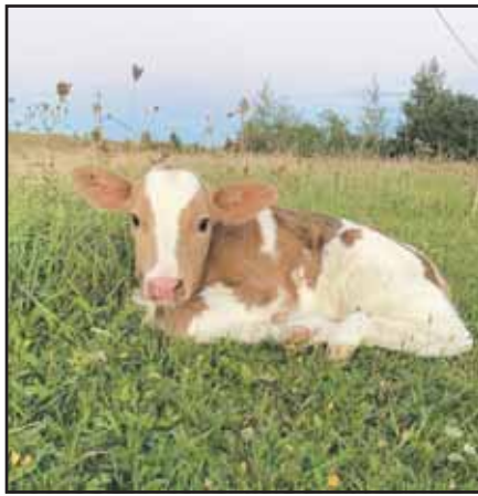
Kęstutis Kavaliauskas dabar didžiausią dėmesį skiria mėsinių galvijų bandai.