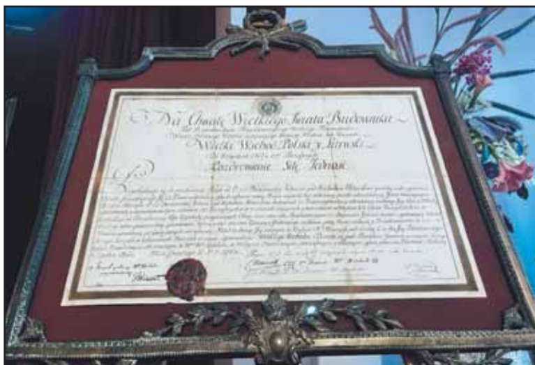
Renginio mecenatas R. Baranauskas eksponavo asmeninės kolekcijos dokumentą, susijusį su Lietuvos masonų veikla.