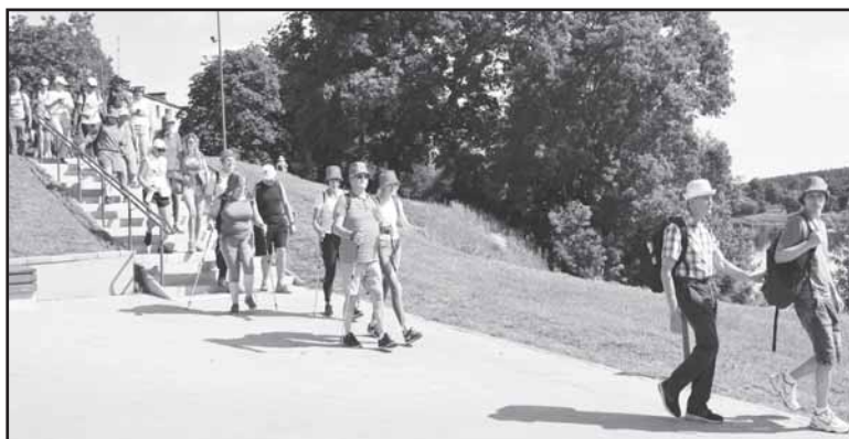
LASS žygeiviai Prienuose.

Informacija parengta įgyvendinant projektą „Pėsčiųjų žygiai“, kurį bendrai finansuoja Sporto rėmimo fondas, kurį administruoja Švietimo mainų paramos fondas.