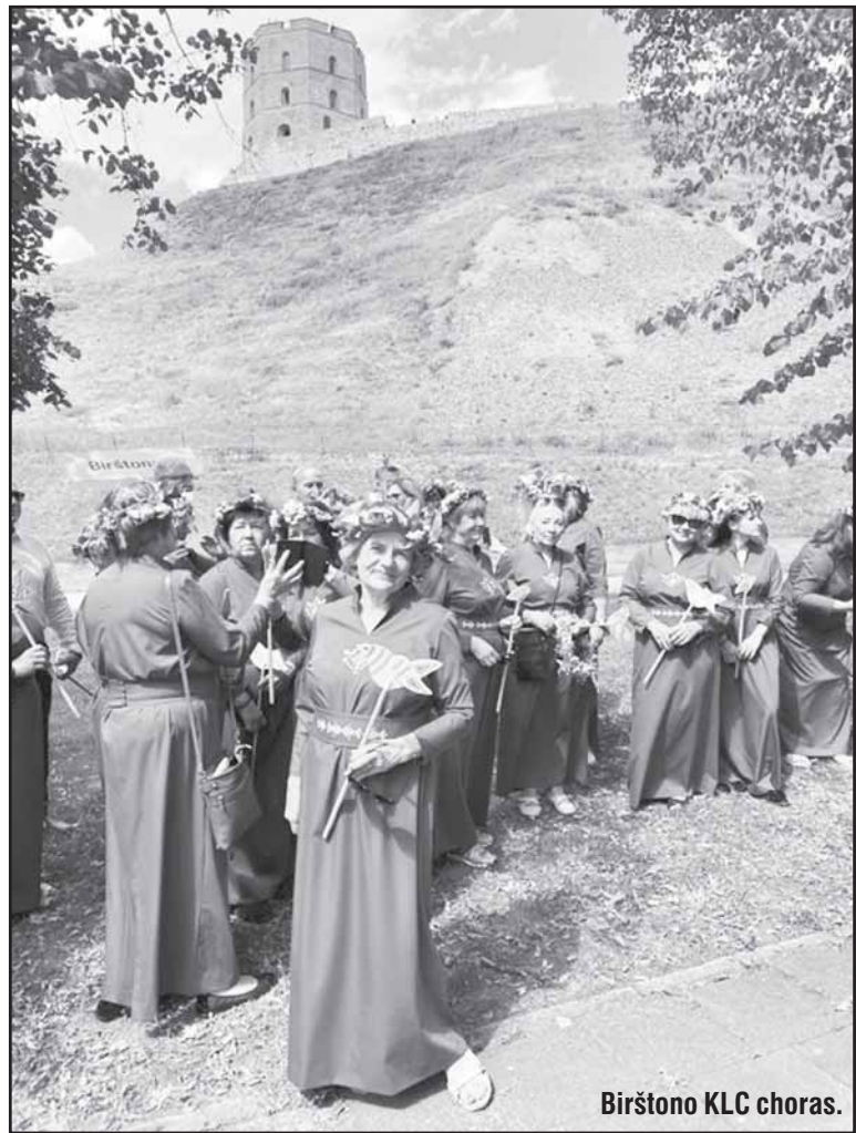
Birštono KLC choras.