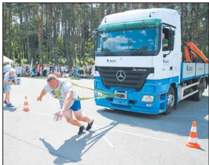
Sunkiasvorio vilkiko tempimo rungtis.