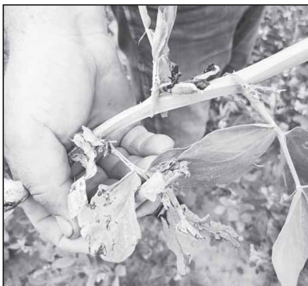
Krušos nukapatos pupos.

Pasitaikė laukų, kurių pakraščiais galvas kelia usnys, jų sėklos dirvoje dygimui palankaus laiko gali kantriai laukti ir dešimtmetį.