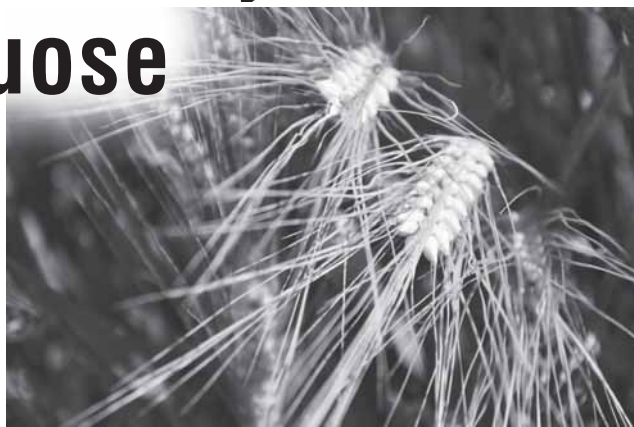
Ar nokstančios varpos pranašauja gerą derlių?

Atrodo, dar tik prasidėjo vasara, o daugelyje laukų miežiai jau gelsta, spartus jų nokimas artina javapjūtę, bet ar ji pripildys