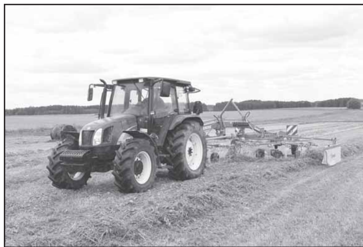
Nemažai ūkininkų paramos lėšas naudoja geresnei žemės ūkio technikai įsigyti.

„Įvertinus dabartinę geopolitinę situaciją, manau, parama