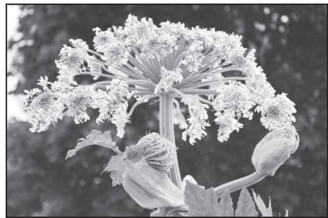
Sosnovskio barštis – sunkiai išnaikinamas invazinis augalas.