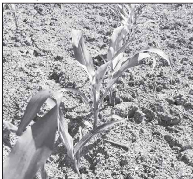
Kukurūzų pasėlis atrodo prastokai.

Apibendrinant tai, kas buvo pamatyta, akivaizdu, kad kaime netrūksta šeiminiškių ūkininkų, kurie pakeles ties savo laukais tvarkingai nusišienavę ir neleidžia piktžolėms plisti. Paprašyti seniūnų jie su technika nušienauja ir kitus plotus, pagelbsti ir kaimynams. Visgi bendras žole apleistų pakelių vaizdas, ypač atokiau nuo pagrindinių kelių, liūdina, juolab kad kasmet šioms reikmėms iš savivaldybės biudžeto skiriama lėšų. Galbūt pasirinktas rangovas nespėja šienauti ar neturi pakankamai technikos?