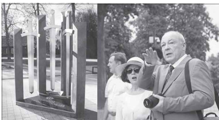
Prie paminklo trims Nepriklausomos Lietuvos gynėjų kartoms. Poemos vertėjo dr. Sigitos Narbutos manymu, labai svarbu, kad Jiezno miesto aikštėje puošiantis kuklus, šiuolaikiškas paminklas kartu raiškiai liudija ir Viešpaties dešinės galybę.