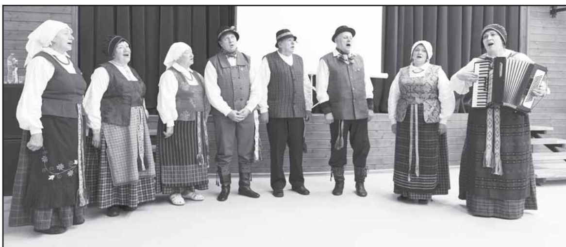
Partizanų dainas dainavo Jiezno kultūros ir laisvalaikio centro ansamblis „Jieznelė“.