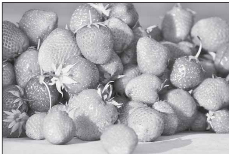
Viena iš ekologiniams ūkiams teikiama paramos naudų – visuomenė gauna kokybiškesnio maisto, gerinama žmonių sveikata.

Paraiškas paramai gauti gali teikti fiziniai ir juridiniai asmenys, atitinkantys aktyvaus ūkininko reikalavimus, nustatytus Paramos už žemės ūkio naudmenas ir kitus plotus bei ūkinius gyvūnus paraiškos ir tiesioginių išmokų administravimo bei kontrolės taisyklėse. Tinkamas paramai plotas turi būti ne mažesnis kaip