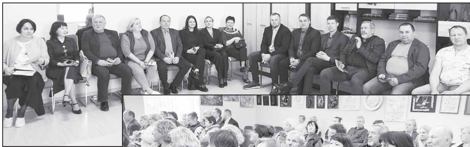
Seniūnaitių ir bendruomenių pirmininkų susitikime aptarti kelių remonto ir kiti planuojami darbai.

Kaip vėliau savo ataskaitoje pastebėjo seniūnas, 2023 m. seniūnijos kelių priežiūrai išleista 212490,99 euro, iš kurių kapitaliniam remon-