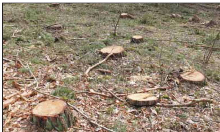
Štai kas liko iš šilavotiškių mylimo trakelio. Jau iškirsta 3 ha miško.