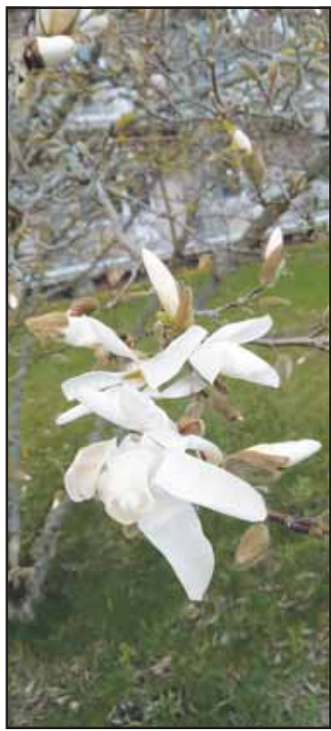
Birštone pražydo magnolijos.

Birštone esu pirmą kartą. Sutvarkyta Nemuno krantinė, gražūs gamtos vaizdai.