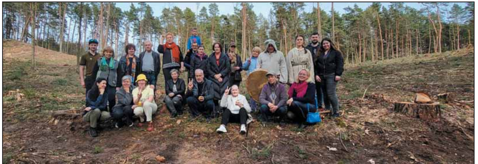
„Išsaugokime Šilavoto Trakelį“ akcijos dalyviai tiki, kad sveikas protas nugalės, ir miško kirtimai liausis.

Kaip sako iniciatyvinės grupės atstovai, Šilavoto bendruomenė ir jos istorija yra ypatingai susieta su Trakeliu. Ateities vizijose bendruomenė yra numaciūsi šią rekreacinę miško erdvę išnaudoti pažintiniams tikslams, sukuriant edukacinius maršrutus, kuriais vaikščiotų ne tik