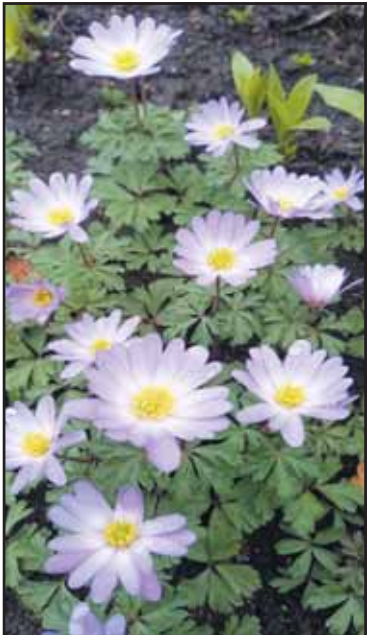
Pirmieji pavasario žiedai.

– Atvykau iš toli, iš Gargždų. Anksčiau važiuodavau gydytis į sanatoriją „Gradiali“ Palangoje, bet šiemet jie neteikia ambulatorinės reabilitacijos paslaugų (tik komerciniai pasiūlymai), tad atvykau į „Versmę“.