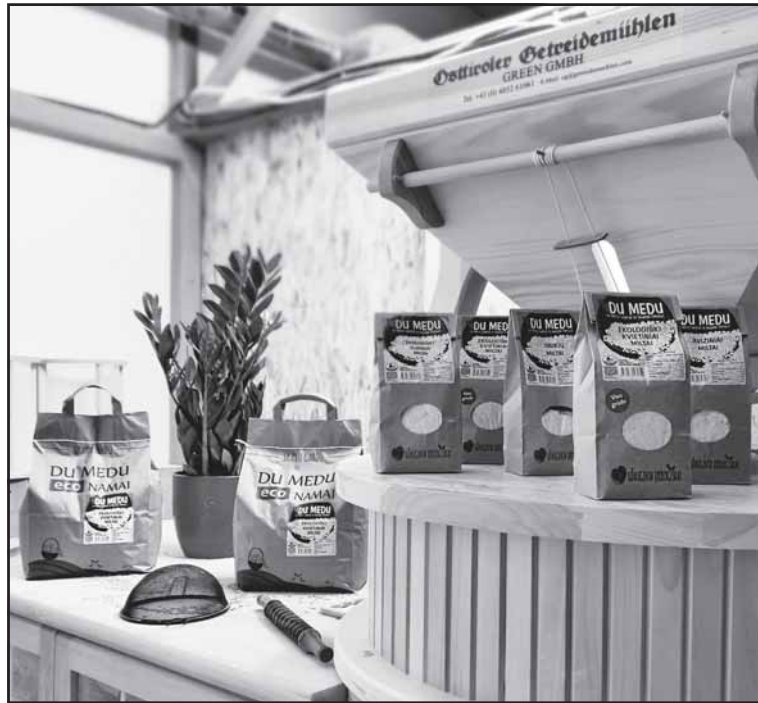
Įmonei „Du Medu“ gavus paramą, jos produkcija šiuo metu pasiekia didesnę ratą žmonių.

Bendrovės vadovas teigia, kad parama naudinga ir pareiškėjams, ir valstybei. „Mes lengviau rea-