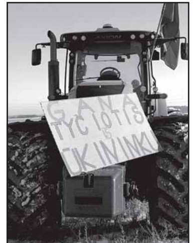
Ūkininkai, atvykę su technika, iškėlė protesto plakatus.