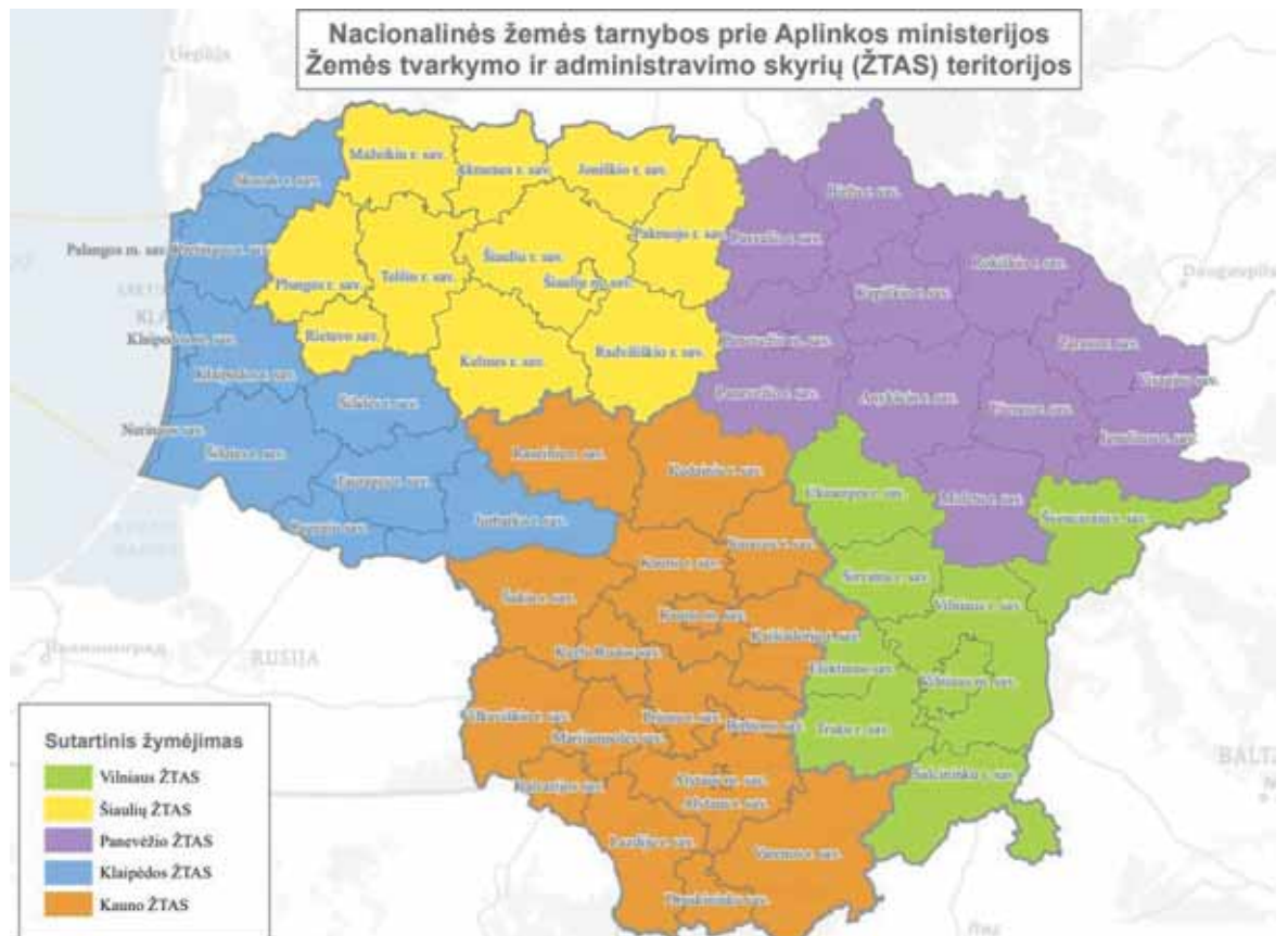
Vilniaus, Kauno, Klaipėdos, Šiaulių ir Panevėžio apygardų žemės tvarkymo ir administravimo skyrių teritorijos.

Nacionalinės žemės tarnybos prie Aplinkos ministerijos Žemės tvarkymo ir administravimo skyrių (ŽTAS) teritorijos