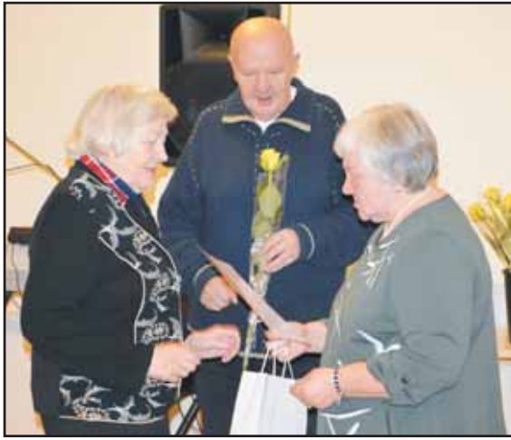
Renginio metu pagerbti jubilatai.