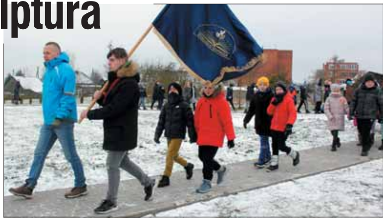
Stakliškių gimnazijos moksleiviai.