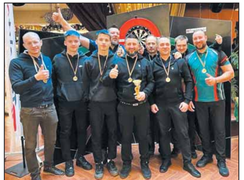
„Stadiono“ sporto klubo smiginio žaidėjai.

Gruodžio 2-3 dienomis viešbutyje-restorane „Via Baltica“ vyko tradicinės Lietuvos smiginio reitingo varžybos „Lietuvos čempionatas 2023“. Į šias varžybas susirinko 183 smiginio profesionalai. „Stadiono“ sporto klubui atstovavo dešimt žaidėjų.