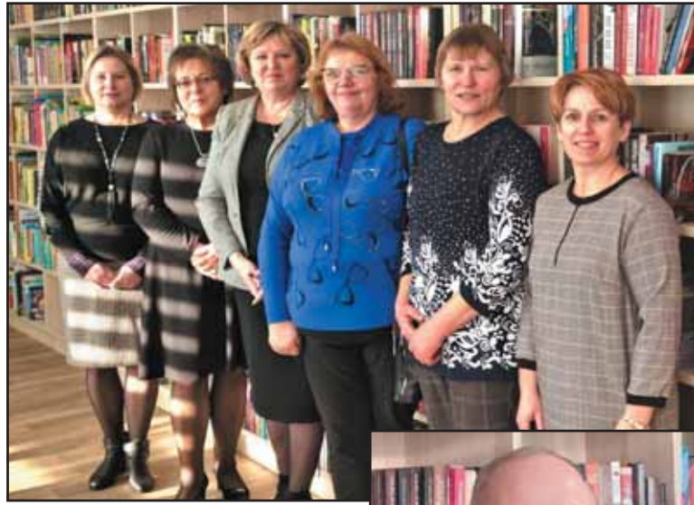
Gražus bibliotekininkų būrelis.

bendruomenės namai bus gyvi, taps visų traukos centru, tęs įprastą veiklą ir, žinoma, kvies naujoms.