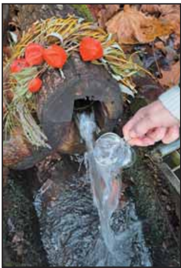
Stebuklingų galių turintis Revuonos šaltinio vanduo.

Prienuose, to meto pažangūs žmonės padarė didelę įtaką miesto raidai, todėl žygio metu aptarti su jų asmenybėmis, šeimomis ir skaudžiomis dramomis susiję gyvenimo epizodai, kurie liudija juos buvus Lietuvos bei Prienų patriotais.