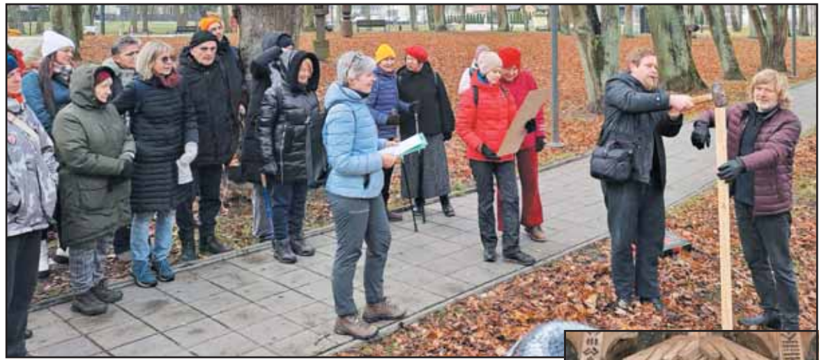
Maršrutas prasidėjo Revuonos parke prie to paties pavadinimo upelio atšakos, kurios pakrantėje pavasarį bus pastatytas VŠĮ „Meninė drožyba“ išdrožtas medinis stogastulpis su įrašytu vandenvardžiu.

Jų santakoje gyvenantys žmonės gražiai susitvarkę pakrantes, ir didįjį Prienų potvynį iki pastatant Kauno HE, kuomet iš apsemtų namų teko išplaukti veltimi, jiems primena tik senos fotografijos. Tačiau paupio gyventojai jau keletą metų kenčia nuo ore tyrančio stipraus naftos junginių kvapo, plika akimi matomos vandens paviršiuje raubuliuojančios teršalų dėmės. Pasak informuotų žmonių, taršos šaltinis grunte dar nunistatytas, nors tam sutelktos aplinkosaugininkų pajėgos ir atlikti keli gręžiniai.