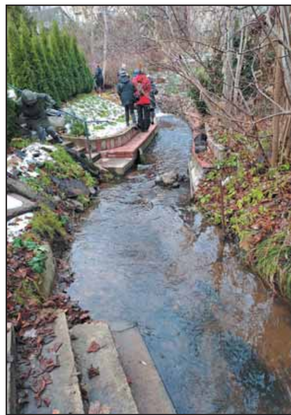
Revuonos upelio pakrantėmis.