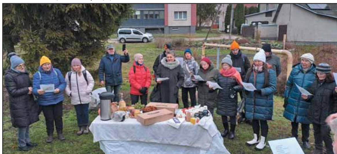
Po žygio „Anties sodo“ bendruomenė pakvietė žygeivius pabendrauti sutvarkytoje lauko erdvėje.