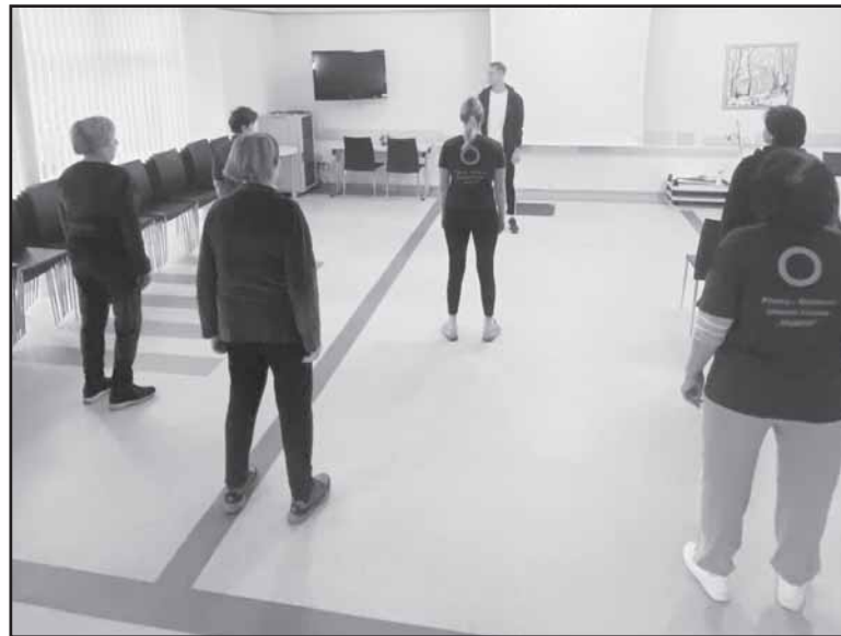
Fizinio aktyvumo užsiėmimai su klubo „Vermė“ nariais.

Prienų rajono - Birštono diabeto klubas „Vermė“ lapkričio 18 d. (šeštadienį) 11 val. kviečia į Pasaulinės diabeto dienos minėjimą ir klubo narių susirinkimą.