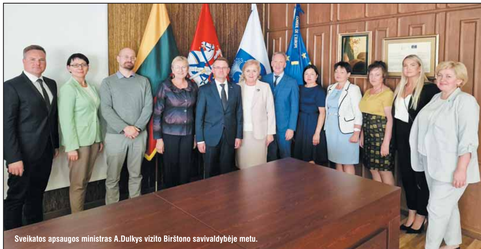
Sveikatos apsaugos ministras A. Dulkytis vizito Birštono savivaldybėje metu.

Birštono savivaldybė – jau dvidešimtoji, kurią per savo kadenciją aplankė sveikatos apsaugos ministras Arūnas Dulkytis. Rugsėjo 15 dieną ministras kurorte susitiko su Savivaldybės, sveikatos priežiūros ir reabilitacinio gydymo įstaigų vadovais, gydytojais, apžiūrėjo Birštono pirminės sveikatos priežiūros centrą bei slaugos skyrių, užsuko į „Vermės“ ir „Tulpės“ sanatorijas, pasveikino „Eglės“ sanatorijoje vykusio Slaugytojų forumo dalyvius.