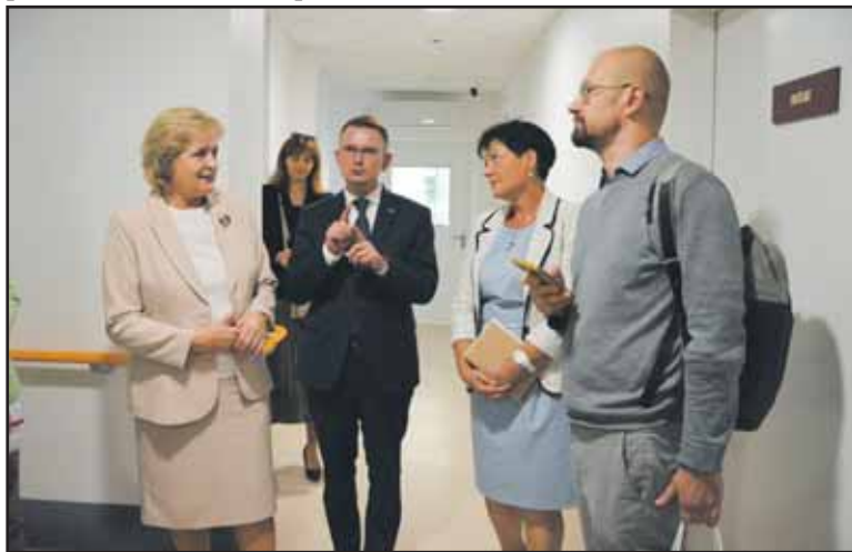
Birštono pirminės sveikatos priežiūros centre.