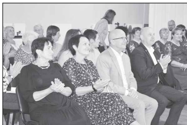
LASS Prienu filialo atskaitinio susirinkimo svečiai.

Parengė Dalė Lazauskienė Autorės nuotraukos