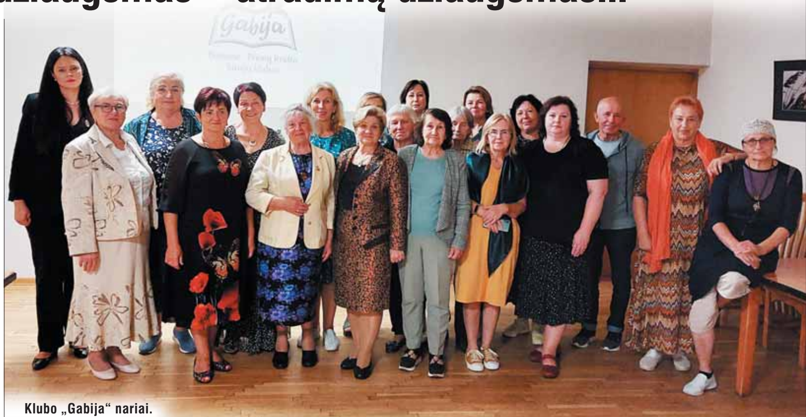
Klubo „Gabija“ nariai.