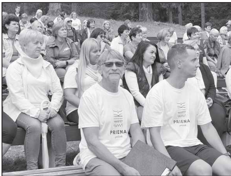
Prieš naujus mokslo metus Prienų rajono švietimo bendruomenė surengė pikniką Prienų vasaros estradoje.