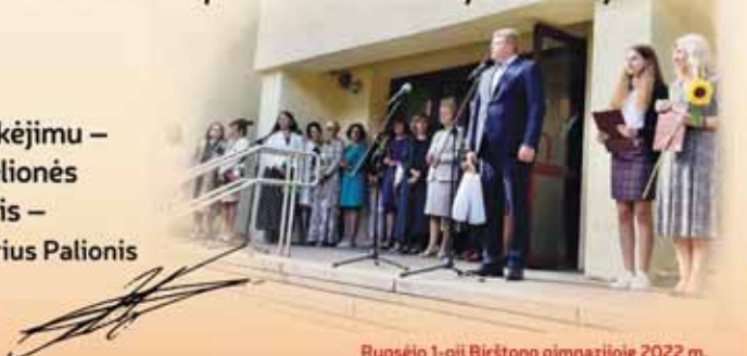
Rugsėjo 1-oji Birštono gimnazijoje 2022 m.