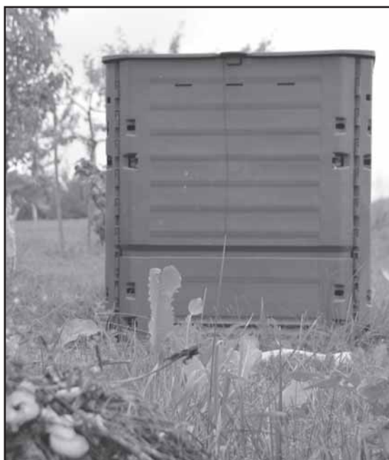
Kompostuoti namuose galima tik pagal aplinkosauginius reikalavimus tinkamas biologines atliekas.

Kompostuojamose atliekose neturi būti pavojingų