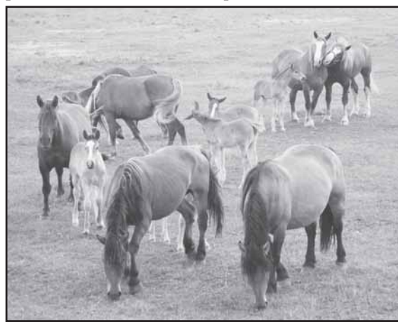
Netoli Leskavos ganėsi graži arklių kaimenė.