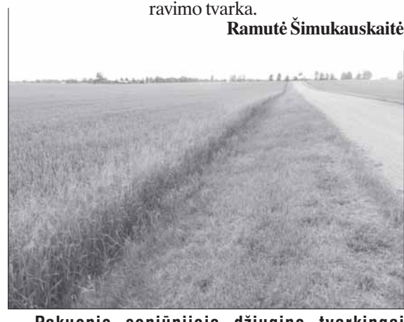
Pakuonio seniūnijoje džiugino tvarkingai nušienautos pakelės.