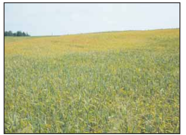
Sausra padarė savo.