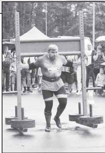
Naščių nešimo rungtis.