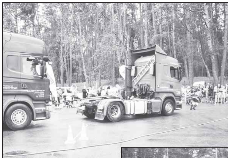
Vilkikų traukimo rungtis.