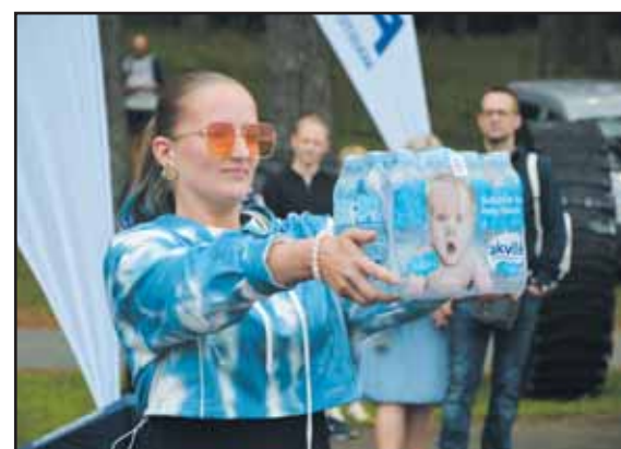
Rungtis „silpnosios“ lyties atstovėms.