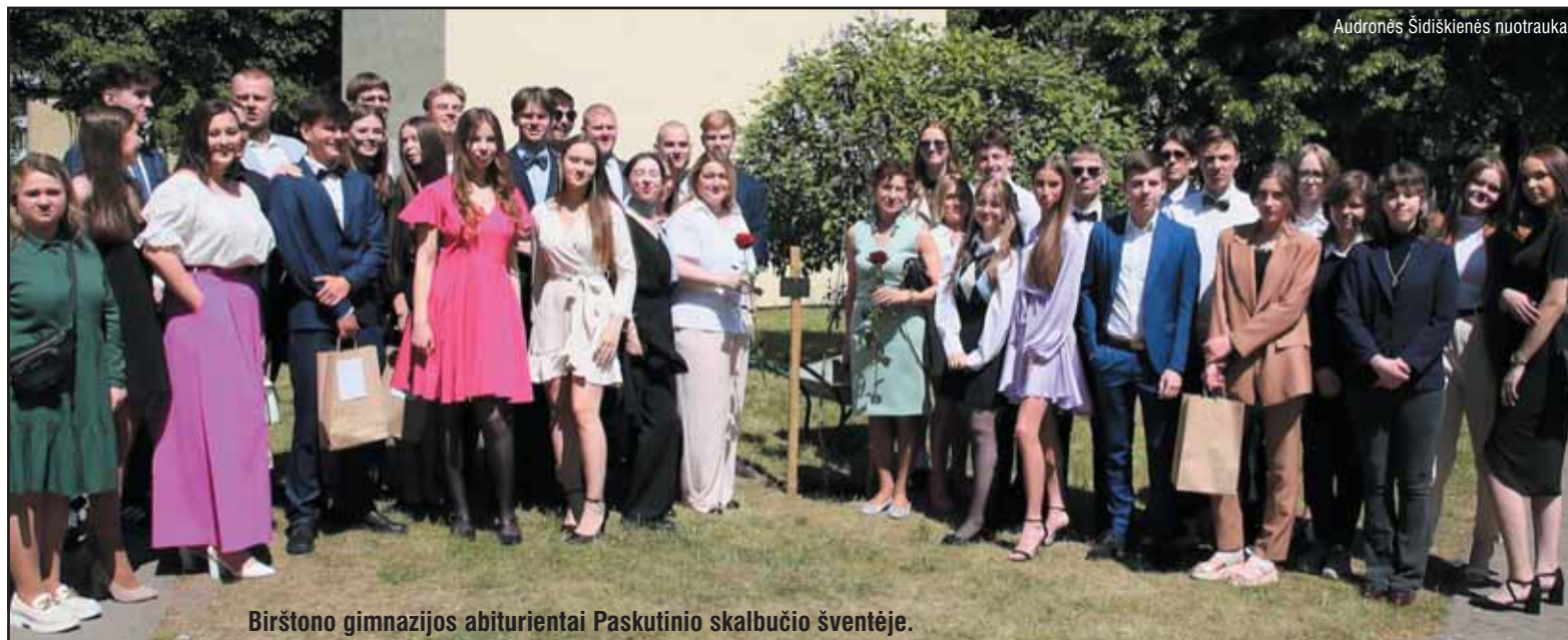
Birštono gimnazijos abiturientai Paskutinio skalbučio šventėje.