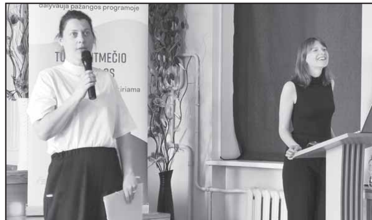
Europos socialinio fondo agentūros atstovės buvo pasirengusios atsakyti į Prienų rajono ir Birštono savivaldybių švietimo bendruomenėms rūpimus klausimus.

kilpų regioninis parkas, „TikoTiks“ centras, Prienų rajono savivaldybės socialinių paslaugų centras, Valstybinės miškų urėdijos Prienų regioninis padalinys, Lietuvos nuotolinio ir e. mokymosi asociacija bei Vilniaus Gedimino technikos universitetas.