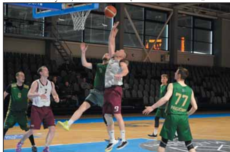
„Pušynės“ – BC „Pakuonis-Energija“ dvikova.