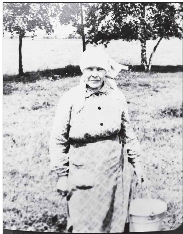
Būdama aštuoniasdešimties močiutė dar laikė karvę.