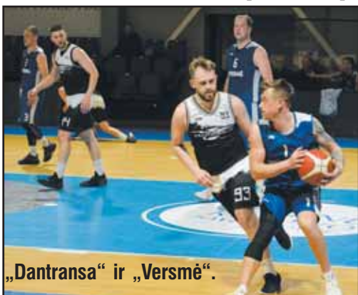
„Dantransa“ ir „Versmė“.

„Versmės“ komandos puolimas tradiciškai buvo paremtas tolimais metimais, o tokia taktika nenuvylė ir šįkart – 5 tritaškius pataikę „Versmės“ snaiperiai padėjo komandai išsiveržti į priekį 24:18. Antrajame kėlinyje „Dantransa“ pagerino savo gynybą ir ėmė artėti prie varžovų. Visus „Dantransos“ komandos taškus per šią atkarpą