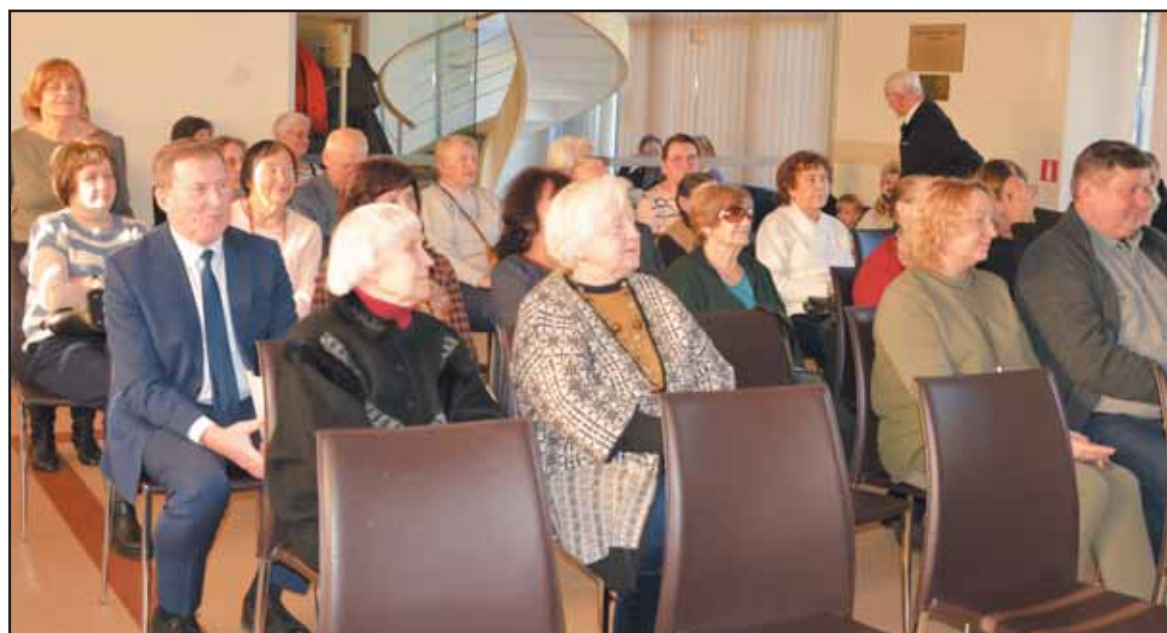
„Šilagėlės“ klubo narių atskaitiniame susirinkime.