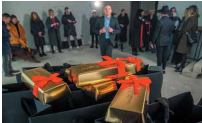
Nemuno parko vystytojai – projekto atidarymo renginyje.

– Mūsų šeima myli Prienus ir gamtą, todėl laisvalaikį vis dažniau leidžiame būtent čia, Nemuno parko kurortinėje aplinkoje. Man vis dar atrodo unikalumu tai, ką pavyko sukurti – gyventi moderniame patogiam būste ant Nemuno kranto, tuo pačiu esi vos pusvalandžio atstumu nuo įmonės ofiso Kaune, geros valandos pakanka pasiekti sostinę Vilnių. Vienu metu – ir komfortas, ir ekologija. Kalbant apie paramą – net ir mažiausia pagalba gali