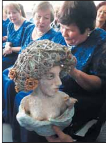
Nuotraukose – akimirkos iš nacionalinės atrankos finalo Lietuvos audiosensorinėje bibliotekoje.

Ansamblio „Puriena“ nariai dėkoja visiems savo gerbėjams, kurie