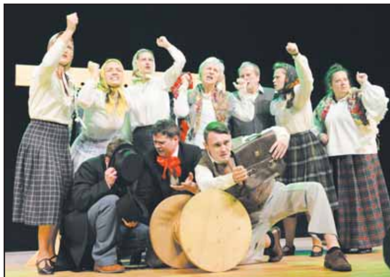
Punsco klijimo teatro aktoriai Birštono žiūrovams parodė nuotaikingą ir nesenstančią B.Sruogos komediją „Kraučius Motiejus“.

Tikslingai pasirinkti lietuviški kūriniai, graži džiūkiška šneka, tautiniai drabužių raštai, saviveikloje dalyvaujantis jaunimas – punskiečiai mums pademonstravo, kad, gyvendami Lenkijoje, jie neprarado prievarta atkirstų tautinių šaknų, ir savo gyvenime, kultūroje ir tradicijose per dešimtmečius išlaikė galbūt netgi daugiau lietuviškumo nei gimusieji Lietuvoje.