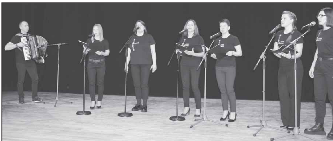
Vokalinis ansamblis „Sūduva“.

Balandžio 2 d.: 12.45 val. kova dėl trečiosios vietos 15.30 val. didysis finalas dėl nugalėtojų vardo 17.30 val. apdovanojimų ceremonija