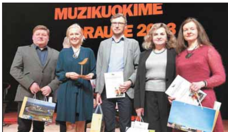
Konkurso vertinimo komisija.

Ansamblių pasirodymus stebėjo ir vertino komisijos nariai iš Lietuvos muzikos ir teatro akademijos, Birštono, Prienų, Neringos meno mokyklų. Konkurso „Grand prix“